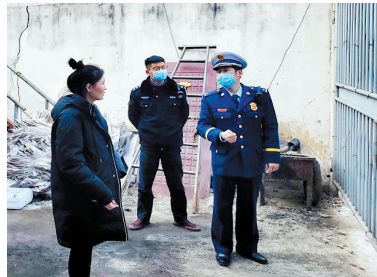
近日,县消防救援大队联合县公安局深入陈家港镇世纪富豪大浴城、馨乐之城KTV等3家场所开展“冬季攻势”场所消防安全整治集中行动。

“评”优秀。召开民主生活会,开展批评与自我批评,既肯定成绩,又找出差距,提升了党支部的凝聚力和战斗力。