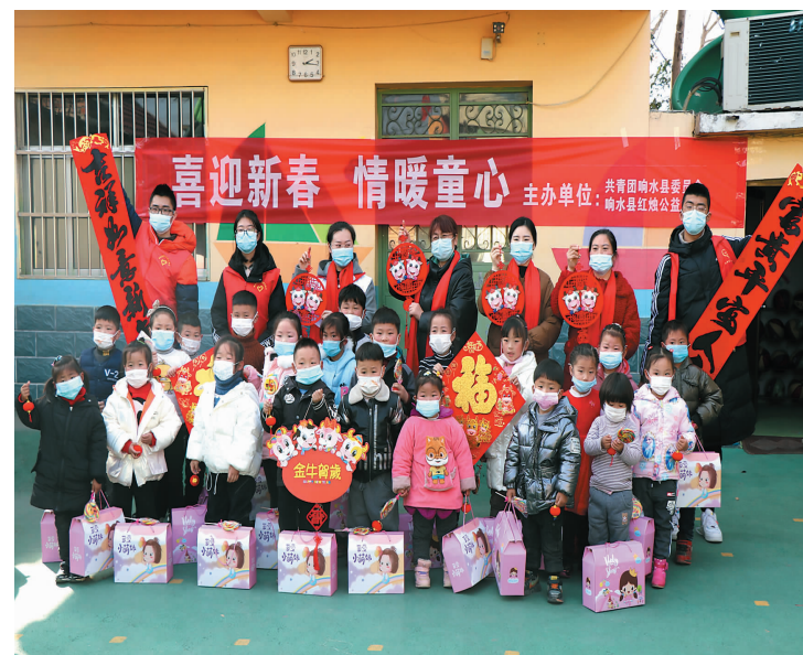
近日,县红烛协会志愿者来到响水镇西园居,开展“喜迎新春,情暖童心”关爱留守儿童活动,同40余名留守儿童欢聚一堂,并给孩子们送上新年礼物。