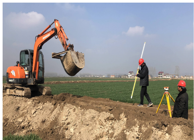
张集中心社区着力实施高标准农田建设,计划建设基本农田5000亩、水泥路11千米、防渗渠21千米、灌溉泵站1座,整个工程确保在4月上旬结束。图为技术人员在测绘现场施工。

12.盗窃电力设施危害公共安全,破坏农业生产,中断群众生活用电,大家都来举报他。