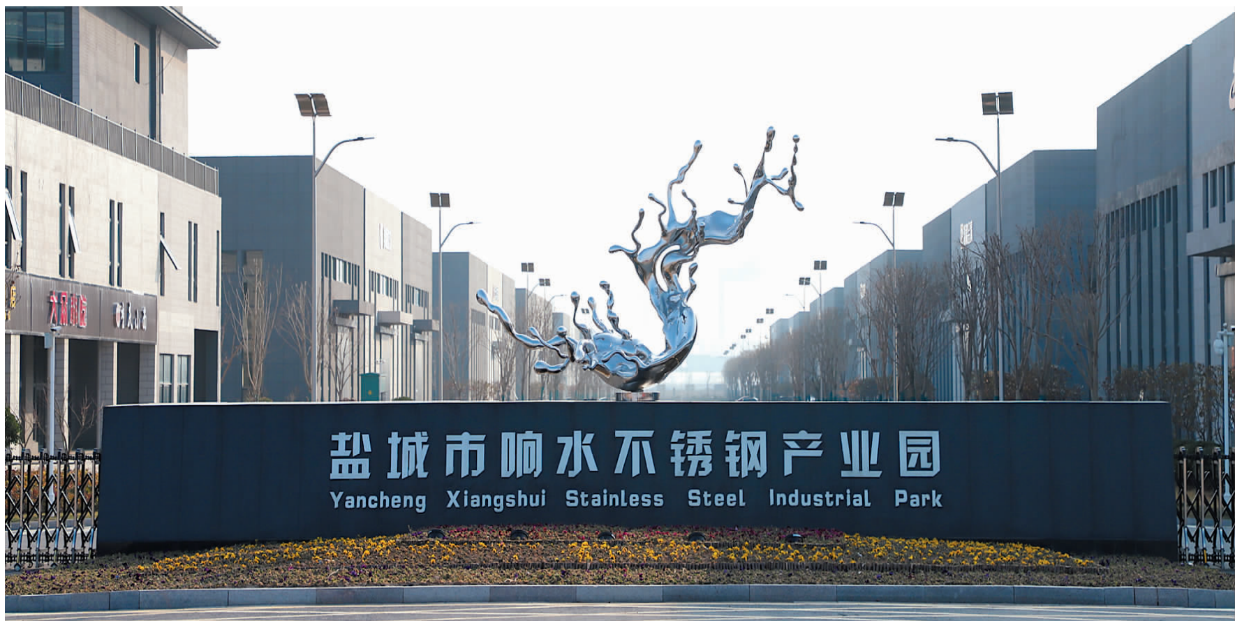
我县按照“千亿级、全链条、集聚式”要求,重点推进不锈钢产业园建设,一期23万平方米已建成,二期24万平方米6月份建成。目前已引进20余家不锈钢企业入驻,全部投产将带动2000人以上就业。