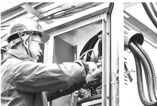
入冬以来,盱眙县供电公司全县镇街用电负荷进行统计,对用电需求大的集市、街道和农村公用配电区新增供电点,满足广大客户用电需求,确保新春佳节供电无虞。图为供电公司官准供电所营销班员工为官准居委会新建电表装置量装。

培训结束后,县交通局对执法人员法律知识掌握情况进行了现场理论测试,此次考试形式为闭卷考试。使从业人员进一步增强法律知识、责任意识和服务意识,将所学的法律知识更好地运用到日常工作中,为合理执法提供有力保障。 通讯员 戚淑娟 彭子轩