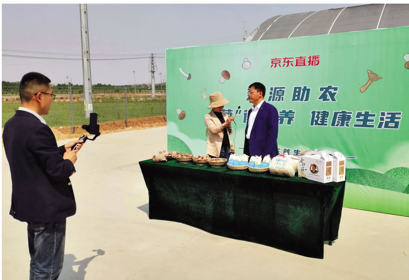
“蘑菇直播” 助推销售升级

市法院院长,市检察院检察长,各镇街、经济开发区、市直各部门主要负责同志等参加报告会。