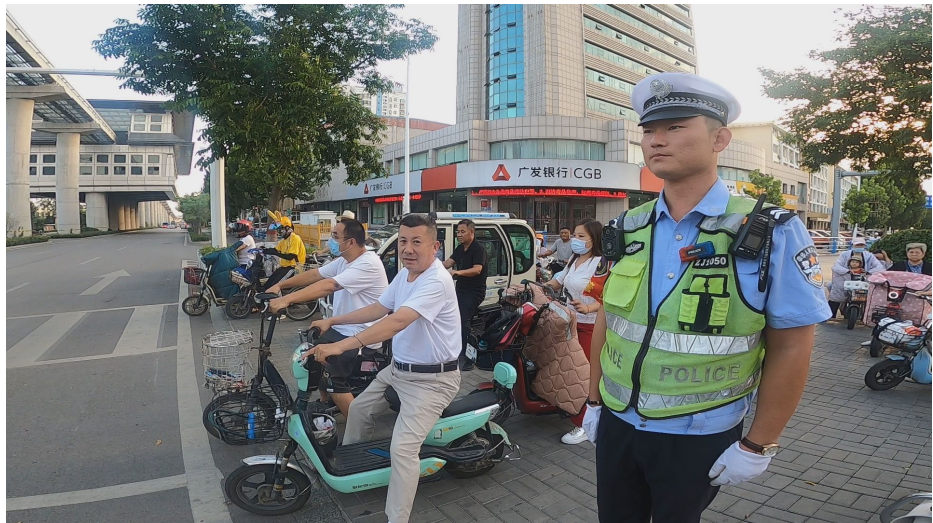
交通高峰时段峰山路上拥挤的车流。

□记者 葛峰 刘夫强 陈雪 栗志楠 孟令羽 通讯员 孔翠玲 侯玉良 环保、快捷、省力、停靠方便、价格亲民……由于兼具机动车和自行车的优势,自第一台国产样车面世至今短短二十余年间,电动自行车得以迅速普及,逐渐成为众多国人短途出行的首选交通工具。根据工业和信息化部及中国汽车工业协会统计的数据,2018 年全国交通工具产量中电动自行车排名第二,仅次于两轮脚踏自行车,成为中国交通工具制造领域产量规模较大的制造产业,其保有量已达到 3 亿辆。 然而, 电动车在给人们生活带来方便的同时,伴随而生的堵塞交通、违章行驶、事故频发、肇事逃逸、失窃被盗等诸多问题也逐渐显现,规范治理迫在眉睫。