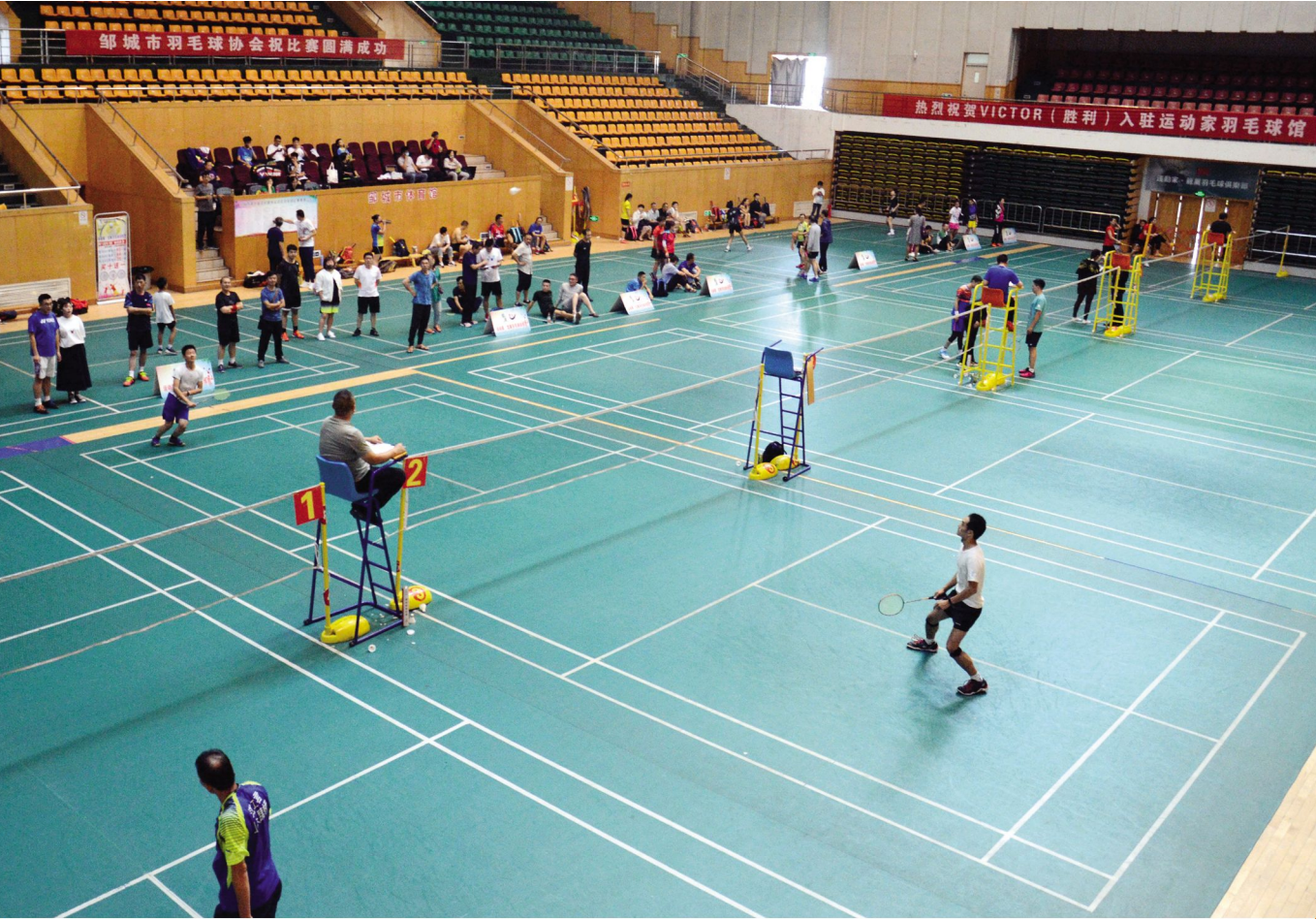
羽毛球开赛 □通讯员 吕锋 报道 9月19日,运动员在参加羽毛球比赛。当日,市第十届全民健身运动会羽毛球比赛在体育公园体育馆举行,设置男、女单打,男、女双打及混双5个组别,160余名羽毛球爱好者参加比赛。

动,伸出援助之手,献出一份爱心,为困难学生撑起一片希望的蓝天;受助学生要珍惜来之不易的学习机会,把党和政府的关怀、社会各界的关心,转化为发奋学习的强大动力,争做有理想、有本领、有担当的新时代青年。