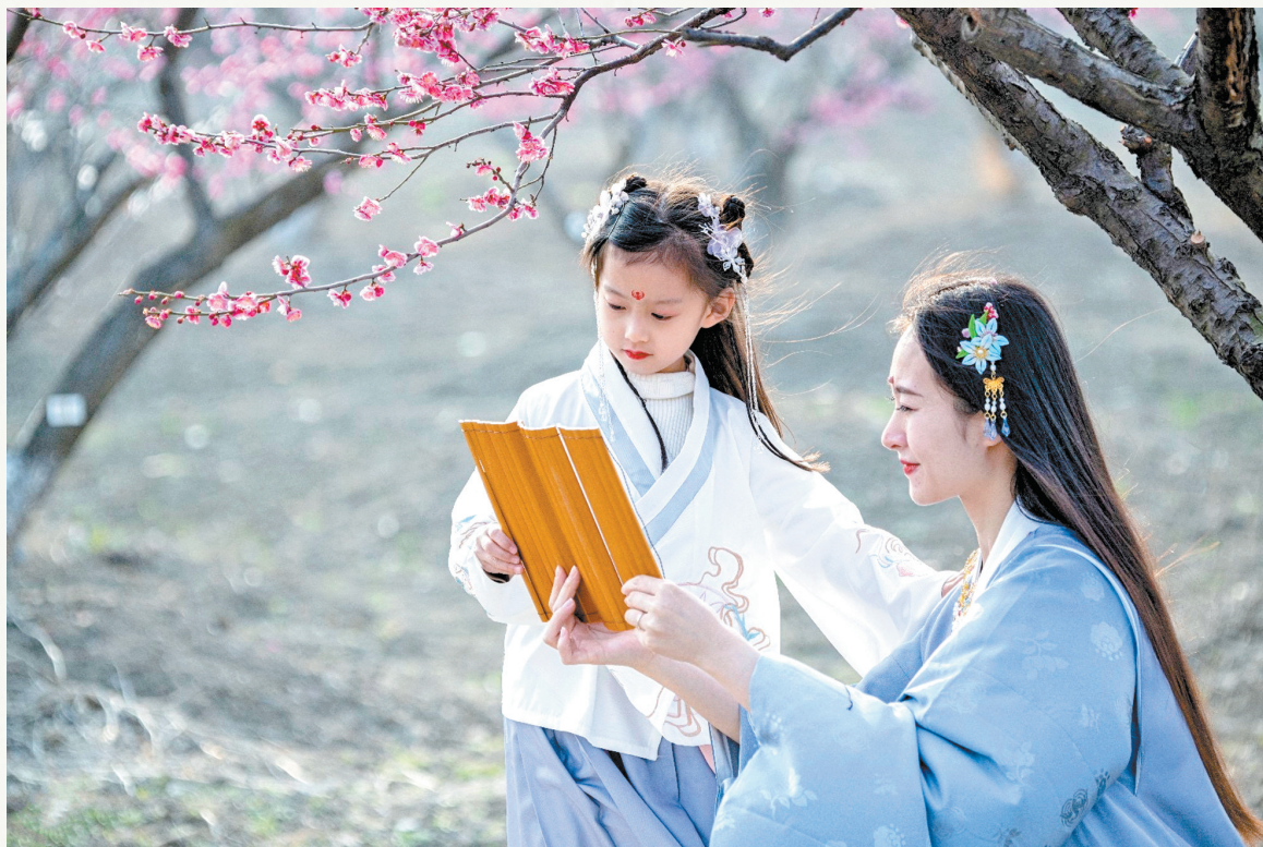
读书不觉已春深

每天晚上,我依然喜欢消夜,但现在的消夜是书,而不是美味,读书消夜,让你饱餐一顿精神美食,大快朵颐。深夜读书,使躁动的心情变得宁静,让枯燥的思绪变得温润。读书消夜,孤灯相伴,心灵在书页间流淌。