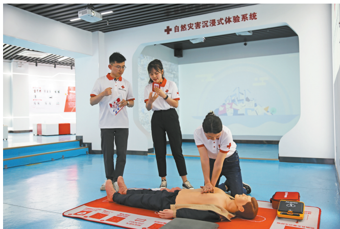
急救培训师对心肺复苏等急救方法的操作流程进行了演示和讲解

本次直播将近2个小时,吸引了超过120万人次的观看和互动。网友们纷纷表示,本次活动通过情景式体验、高科技模拟、游戏式互动等形式开展体验式教学培训,宣传普及急救知识和自救互救技能,让大家模拟场景真实地感受火灾、车祸等灾难的情景,学会自救和互救本领,很有意义。