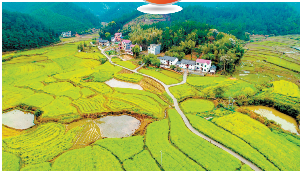
雨后乡村