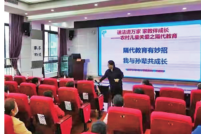
区妇联举行“依法带娃·相伴成长”家庭教育促进法专题培训

目前,全区各级妇联组织接待群众来访来电咨询619件,调解婚姻家庭矛盾纠纷81件,全区妇女群众维权意识和能力不断增强,婚姻家庭关系更加和睦,妇女合法权益得到进一步维护,获得感、幸福感、安全感不断提升。