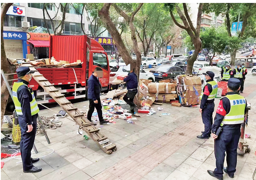
执法人员对商铺占道经营、物品乱堆放的行为进行处理