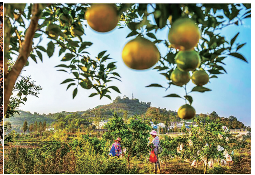
不少柑橘类的水果在冬日成熟,丰富了市民的果篮子