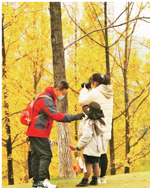
美景如画的中央公园吸引了不少市民前来拍照打卡