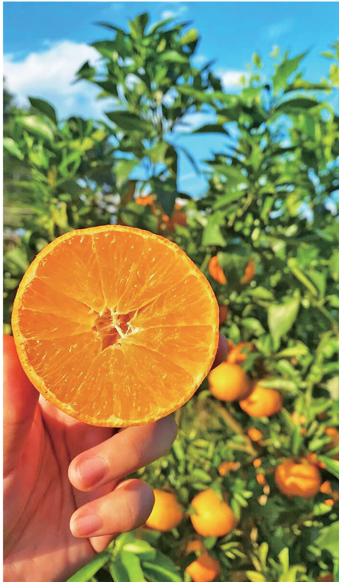
甜美多汁的爱媛橙