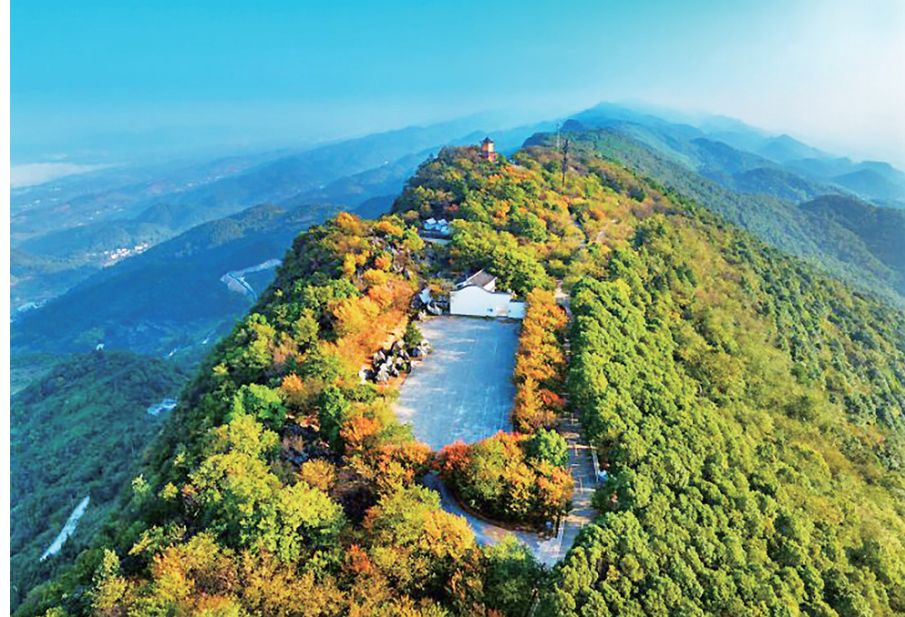
冬日的云台山色彩更丰富