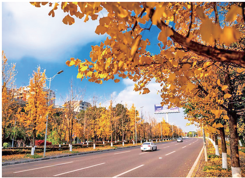
210国道两旁的银杏飘黄,美不胜收