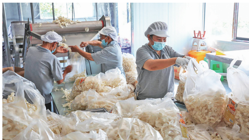
吉星村面厂工作人员正对面条进行分装

保,面厂还流转土地800多亩,种植香糯、菊花、紫薯、香菇、魔芋等生产原材料,高品质的面粉与原汁原味的配料碰撞,独创出花边揪揪面、香糯坚果面、魔芋面、菊花面、果蔬面、杂粮面等十余种产品,深受消费者好评。目前,已注册“古路镇重庆好面条”“花边揪揪面”等多个商标。