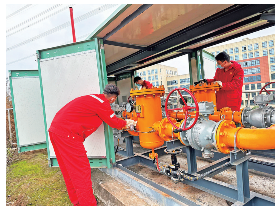
工作人员对设备设施进行维护保养