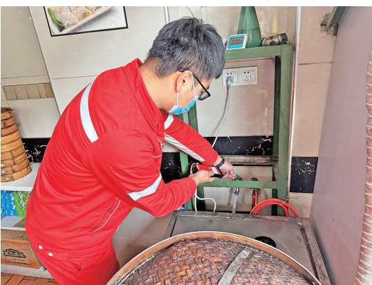
工作人员上门检修