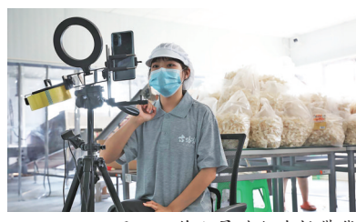
面厂工作人员进行直播带货