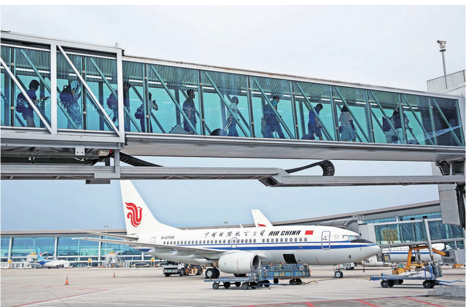
江北机场运输生产逐步恢复 资料图

全会强调，要牢记习近平总书记殷殷嘱托，明确全面建设社会主义现代化新重庆的奋斗目标。习近平总书记殷殷嘱托，作出了《中共重庆市委关于深入学习贯彻党的二十大精神 坚决拥护“两个确立” 坚决做到“两个维护” 在新时代