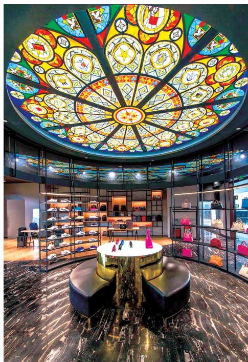
一线大牌陆续入驻

近日,记者在机场逛了一圈,发现机场餐饮“包罗万象”,会让人怀疑走进了美食天堂。目前,在T3航站楼值机大厅、到达层、中心商业区以及各个登机口,汇集了十几个大家耳熟能详的中外餐饮品牌,涵盖中餐、西餐、饮品、甜点等细分业态