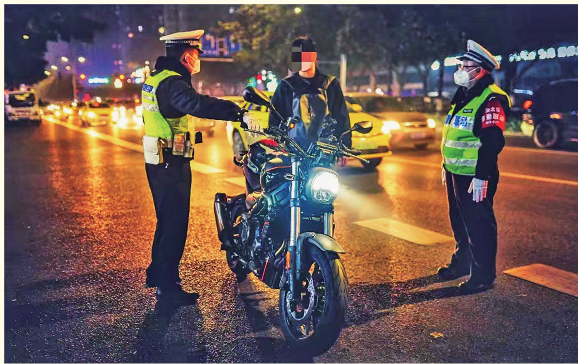
执法人员对摩托车进行执法检查

据悉,1月12日夜间20:00,执法工作队出动15人次在紫荆路路口设卡,针对大功率摩托车活动规律和特点,合理运用多种查缉战术,灵活安全开展查缉行动,对查获的摩托车及驾驶员实施严格检查,逐一核实身份信息,对违法车辆实施“全身体检”,重点检查无牌无证、未按规定安装悬挂机动车号牌、追逐竞驶等交通违法行为。在执法过程中,执法人员遵循文明规范执法原则,对违法驾驶员开展面对面交通安全劝导,责令其清除违法状态,并对过往“摩友”开展交通安全知识宣传,耐心叮嘱“摩友”骑行时