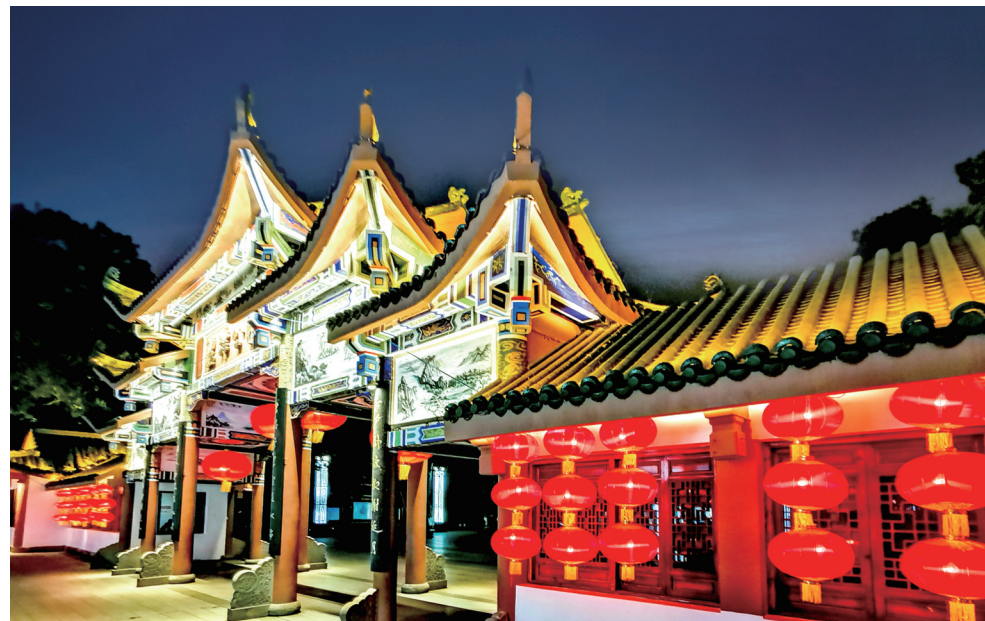
流光溢彩的碧津公园