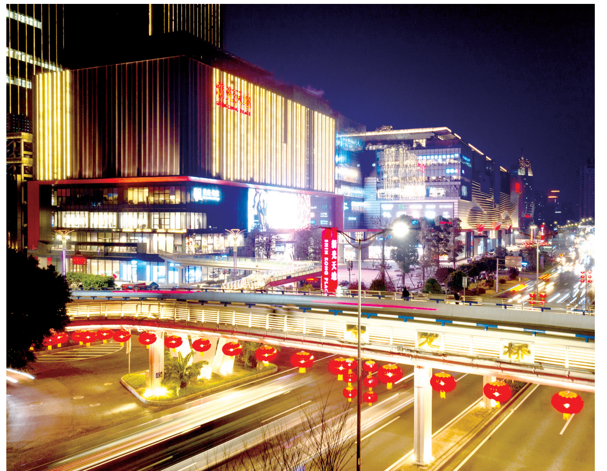
灯火辉煌的红锦大道