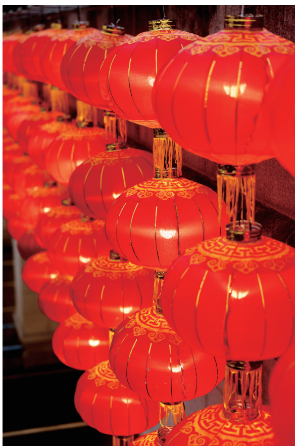
红红的灯笼，喜庆的中国年