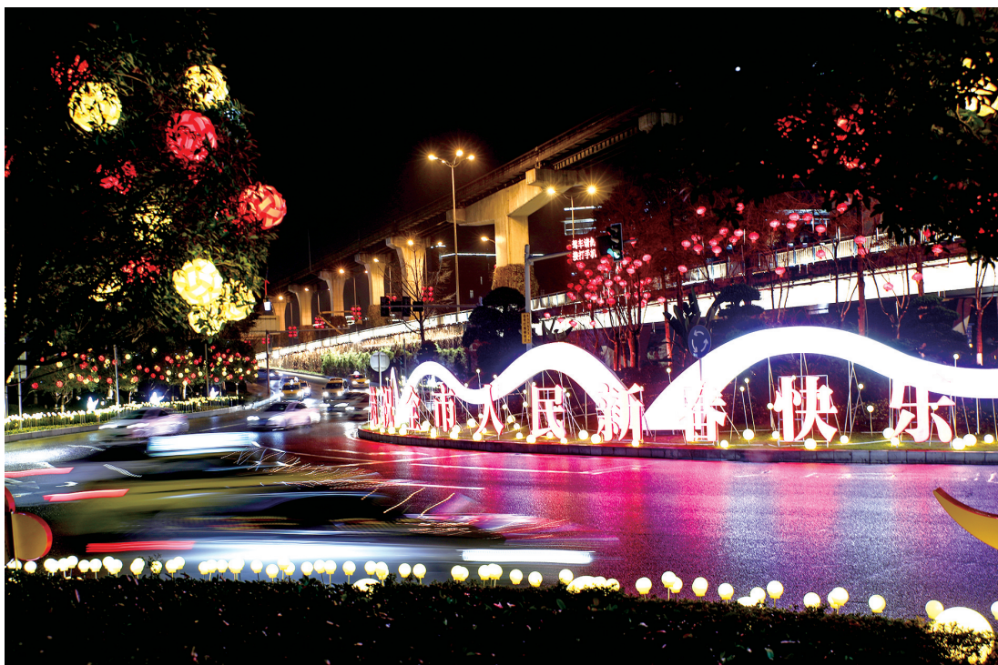
机场转盘设置了飘带状的主题装饰，灵动闪亮，年味浓浓