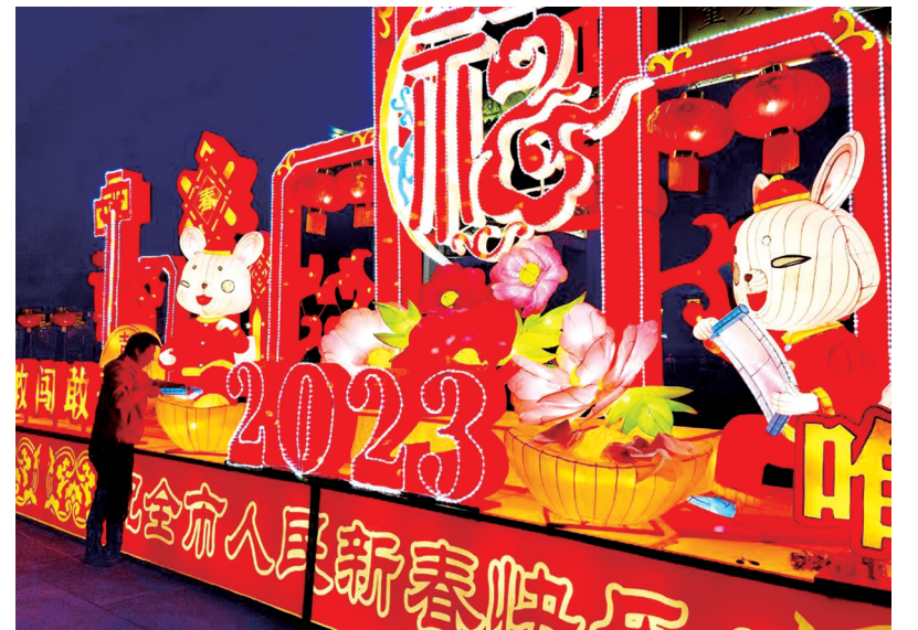
卯兔送福迎新春