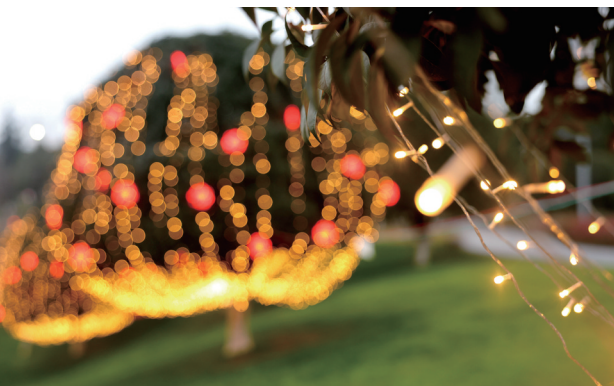
在迎春灯饰的装点下，中央公园的树木和草坪更显靓丽