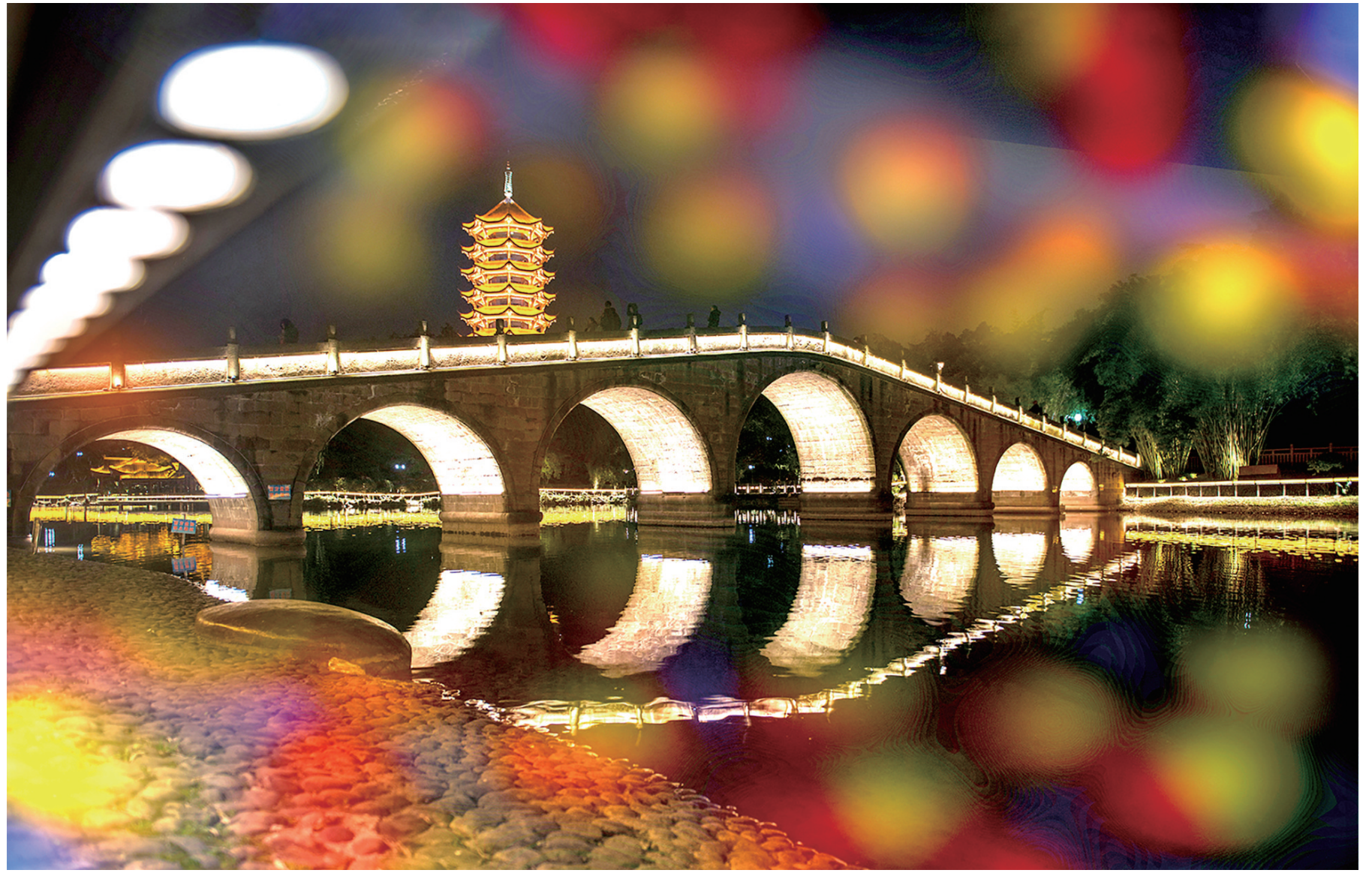
梦幻七夕桥

“看！树上的灯笼亮起来了！真好看！”夜幕降临，如果你走在渝北街头，绚丽缤纷的新春灯饰一定不会错过的风景。璀璨的灯光让喜庆热烈的浓浓“年味儿”弥漫在夜色里，化作美好的祝福迎接2023年春节的到来。