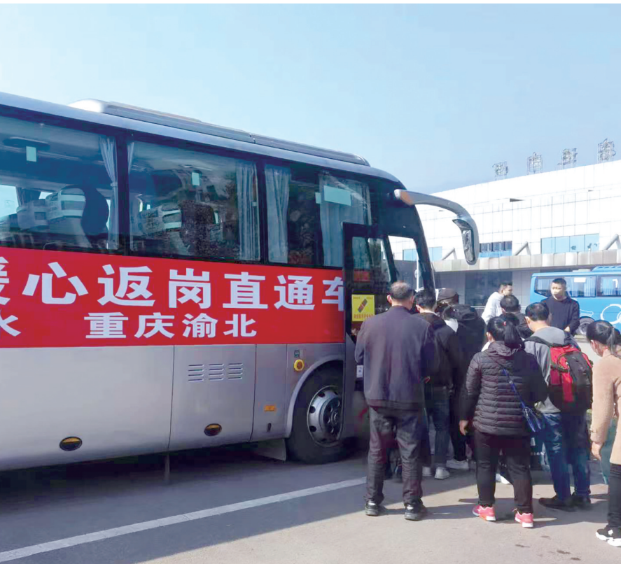
外出务工人员有序候车

据了解,这批“返岗直通车”为渝北区人社部门的首班返岗车辆,后续将根据需求陆续增开“返岗直通车”免费运送务工人员返岗就业。下一步,川渝两地人社部门还将加大宣传力度,加大组织力度,通过“春风行动”,帮助有就业意愿、暂无合适工作的农民工尽快就业。