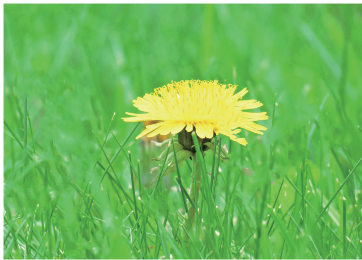
春日黄花