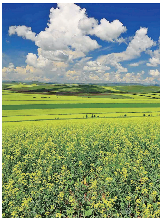
白云与田野的交谈