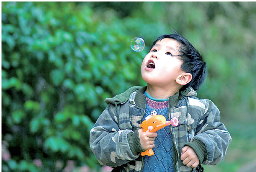
童年的梦