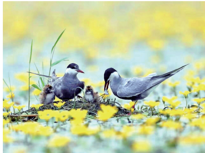
温暖的港湾