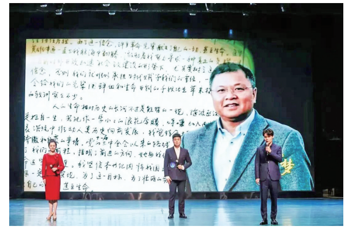
诵读大赛现场

本报讯(记者 唐春琳)春日好时光,正是读书时。2月18日,第六届渝北市民诵读大赛决赛在临空文化剧场举行。