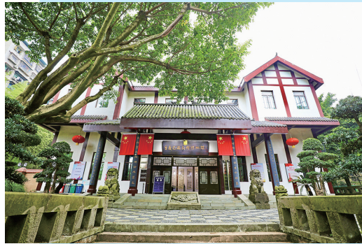
巴蜀民俗博物馆