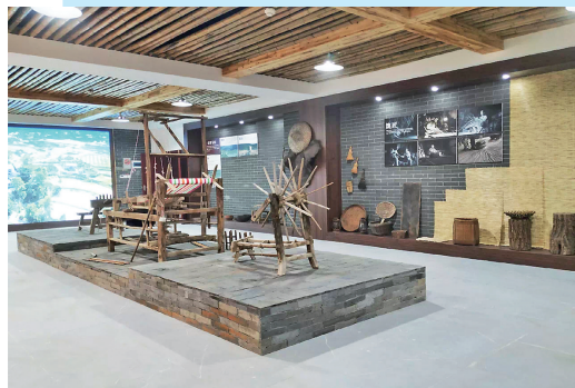
兴隆镇综合文化服务中心乡情馆