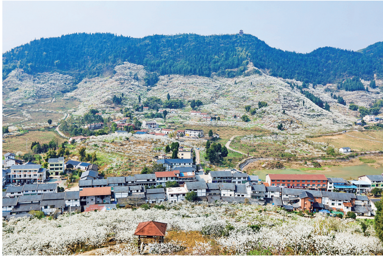
统景印盒,半山李花半山“雪”