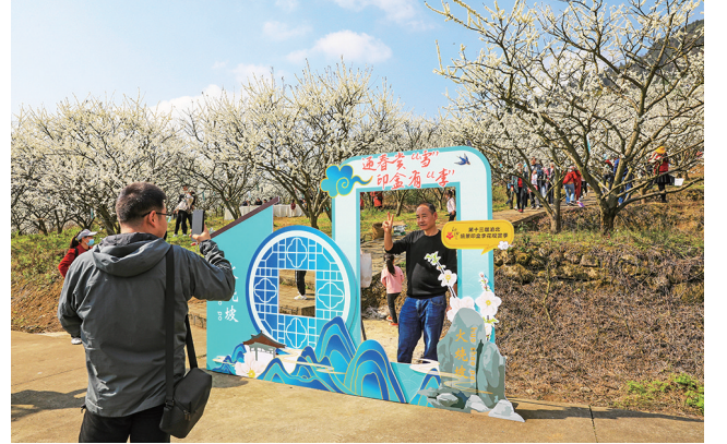
市民赏花踏青,尽享春日美好