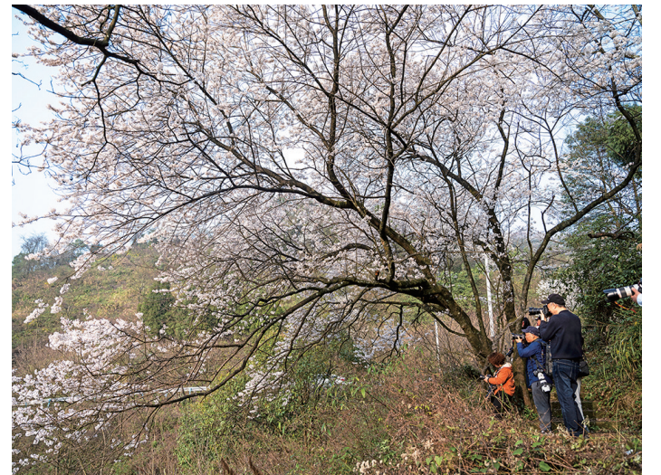
摄影爱好者用镜头记录樱花盛开的春日美景 许可 摄