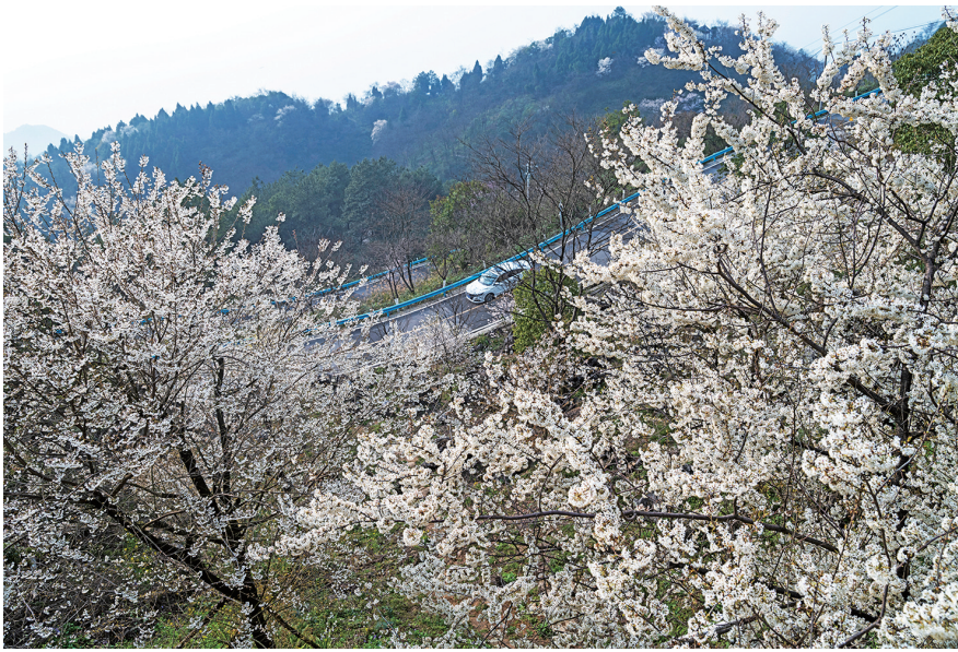
阳春三月,车行渝北,一路繁花相伴