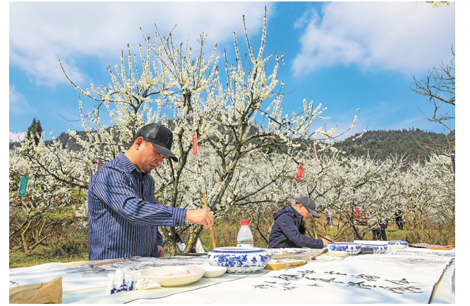
书法爱好者在李花林中挥毫泼墨