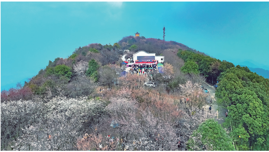
云龟山樱花盛开,前来赏花的游客络绎不绝