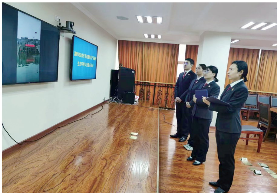
渝北区检察院的检察官们开展“云端”监督,确保劳务代偿履行到位

本着这样的原则,去年4月,渝北区检察院以非法捕捞水产品罪对该犯罪团伙的12名成员提起公诉附带民事公益诉讼,对犯罪情节轻微的杨某甲、杨某乙依法作出微罪不起诉决定。“保护长江生态是我们义不容辞的职责,但刑事打击也不能一刀切。杨某甲、杨某乙处于该地下产业链末端,只对自己实施的犯罪承担责任,他们参与程度轻,捕获的渔