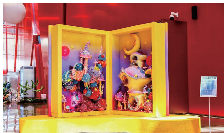
大悦城花植装置艺术展