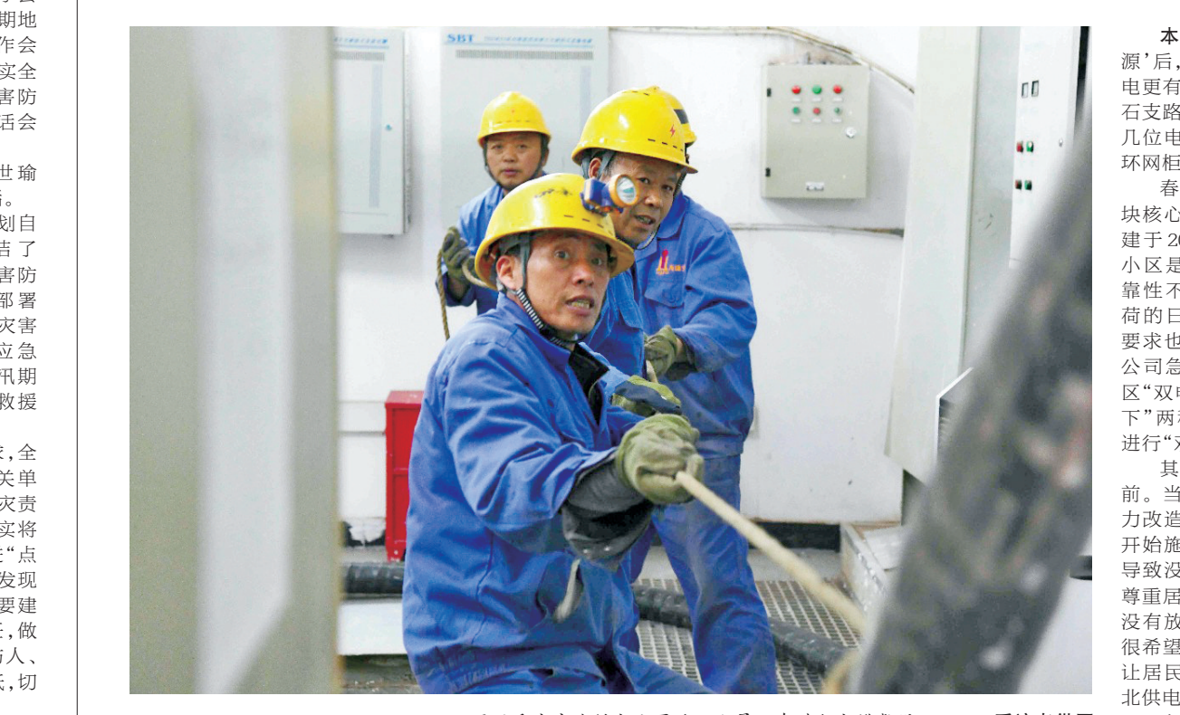
国网重庆市北供电公司施工人员进行电缆敷设

本报讯(记者 杨青)“接入‘双电源’后,相当于装上了‘双保险’,小区用电更有保障了!”4月19日晚,渝北区松石支路春风城市中心老旧小区旁的道路上,几位电力施工人员正在对小区的电力环网柜进行“双电源”改造。