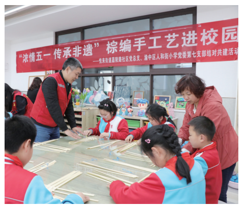
学生们跟着老师学习棕编工艺