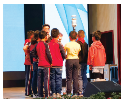
学生“围观”便携式移动气象站

本报讯(记者 胡瑾)近日,仙桃街道花石社区携手川航重庆分公司机务分部机关党支部在悦港中学开展“航空科普进校园 共筑少年强国梦”主题活动,在孩子们心中埋下一颗“航空梦”的种子。 活动中,来自川航重庆分公司的工程师为悦港中学全校380多名师生讲解“神奇的飞机”,展示航空飞机内外部结构设计,让师生们对飞机的设计原理有所了解。工程师用生动形象的讲解、深入浅出的语言,向学生们讲解了发展航空事业的重大意义,从而激发学生对于航空科学的兴趣,为少年一代了解航空知识,塑造航空梦想打下坚实基础。 宣讲结束后,在场的孩子们感到意犹未尽:“我的梦想就是成为一名机长,今天他们的宣讲让我对飞机有了更深入的认识,我觉得我离我的梦想更近了。”希望以后多参加这样的活动,可以了解很