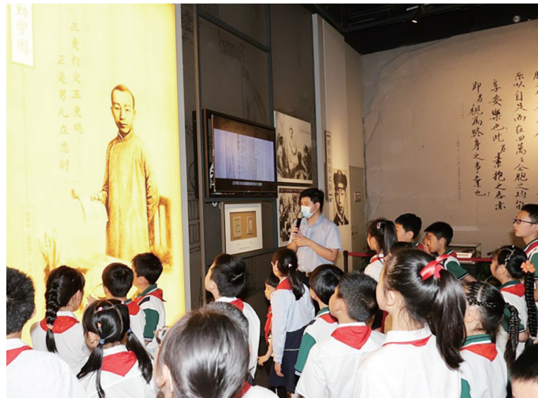
青少年及家长走进聂荣臻元帅陈列馆参观学习

本报讯(记者 杨青)近日,由共青团江津区委、共青团渝北区委主办,江津区青少年服务中心、渝北区青少年活动中心承办的“学习二十大 永远跟党走 奋进新征程”江津·渝北一起向未来研学实践活动在江津举行,100名青少年及家长走进聂荣臻元帅陈列馆,感受红色文化,进行沉浸式研学。 “向聂荣臻元帅敬礼!”活动中,优秀少先队员们在元帅雕塑前敬献花篮、重温入队仪式。少年们跟随讲解员的脚步参观“立志报国”“科技主帅”“新的长征”等五个主题展厅。随后,他们来到农耕研学课堂,了解农时农事,体验制作非遗“米花糖”,开展集体生日会,现场氛围热闹非凡。 此次活动以“红色精神润童心 田园农耕强少年”为主题,旨在传承红色基因,增强爱国情怀,以多样化、沉浸式研学实践形式,讲好红色故事,促进青少年全面健康成长。