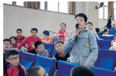
孩子们踊跃提问