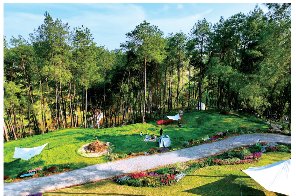
充满梦幻色彩的安的童话森林