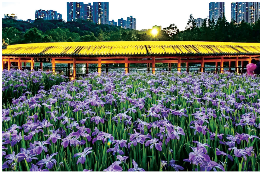
龙头寺公园清音长廊，在灯光的衬托下，花色格外迷人