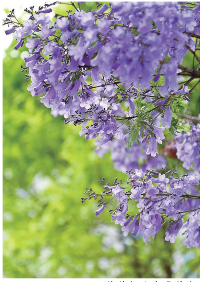
蓝花楹迎来盛花期