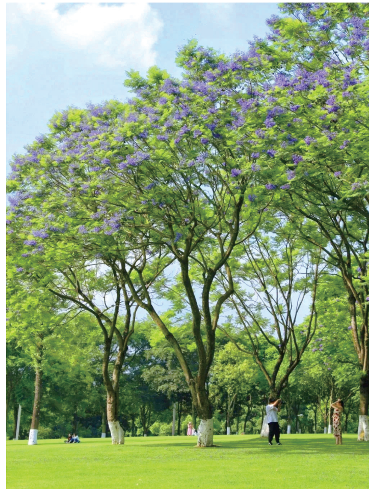
中央公园，美丽的蓝花楹与绿色的草坪相映成趣