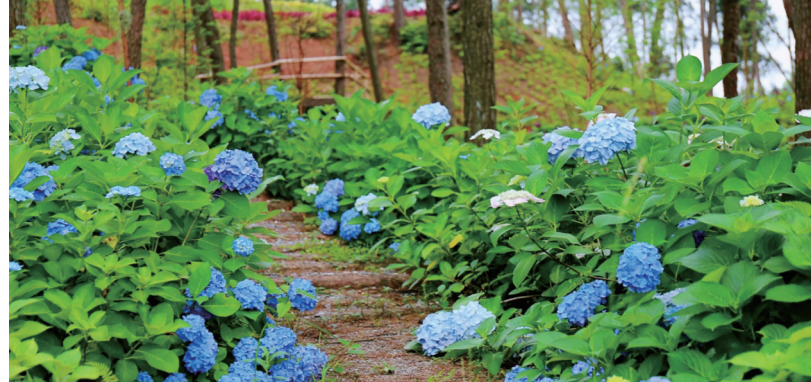
安的童话森林绣球花开