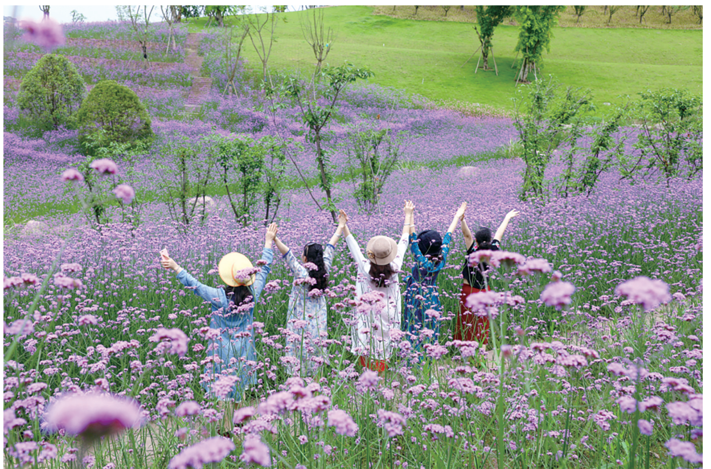
悦来生态城马鞭草盛开