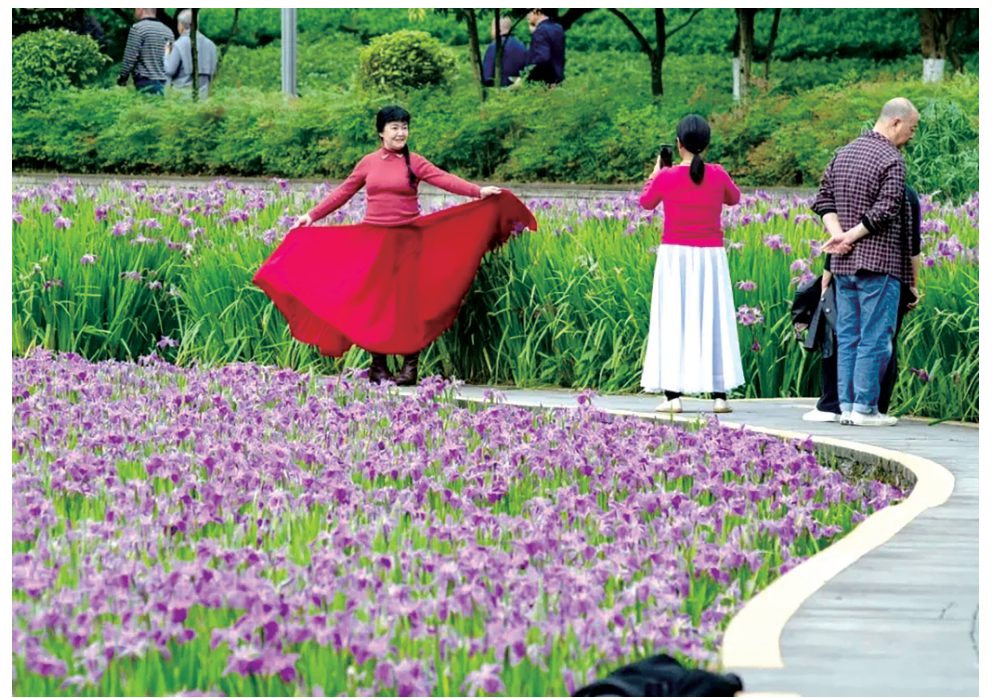
龙头寺公园鸢尾花盛开

中央公园大草坪也迎来了那抹“梦幻紫”，一株株蓝花楹唯美盛开，为初夏的渝北再添一抹浪漫的紫色。蓝花楹优雅、宁静、深远，花儿清新脱俗，在阳光下如云如烟。置身花海，抬头仰望，人也变得柔情、浪漫起来。花开令人欣喜，花落也是佳境。一场夏雨过后，不少蓝花楹跌落枝头，飘落在草地上，留下一地紫色花朵，营造一处童话般的秘境。