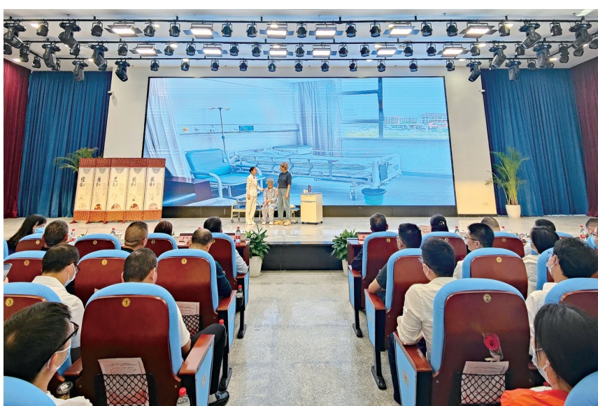
医护人员现场演绎情景剧

据悉,近年来,全区广大护理工作者的努力践行全心全意为人民健康服务的宗旨,以实际行动继承和发扬南丁格尔精神,在平凡的护理工作岗位上,他们充分发挥勤奋学习、刻苦钻研、积极进取的创新精神,服务群众、吃苦耐劳、扎实工作的实干精神,勤勉敬业、不计名利、忘我工作的奉献精神,不断创新护理理念和护理方式,拓展优质护理内涵,为维护人民群众身体健康、促进我区卫生健康事业高质量发展作出了积极的贡献,展现了新时代护理工作者的良好职业道德和高尚的思想品质,受到了广大患者及家属和社会各界的广泛赞誉。