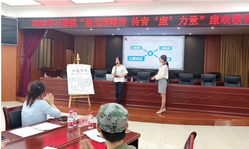
石船镇青年干部在廉政教育活动中踊跃发言,阐述各自观点

会议强调,要坚持不懈用习近平新时代中国特色社会主义思想凝心铸魂,在思想政治上上下下功夫,坚定捍卫“两个确立”,坚决做到“两个维护”;在履职尽责上下功夫,切实推动党风廉政建设与业务工作深度融合、一体推进;在组织上下下功夫,推动基层党组织全面进步全面过硬;在正风肃纪上下功夫,持续营造风清气正政治生态。