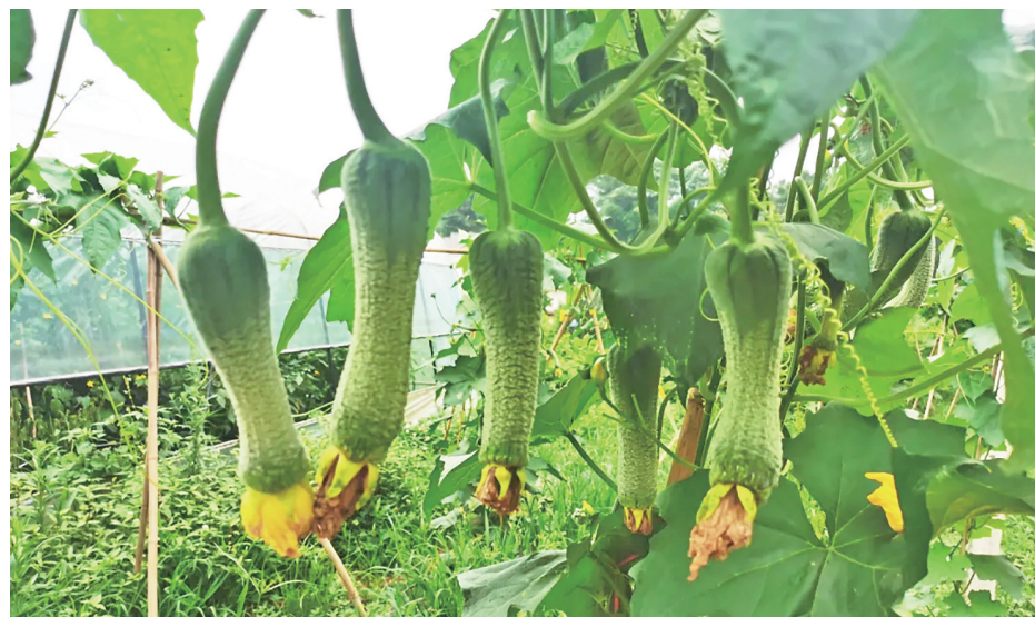
丝瓜是夏天的美味佳肴