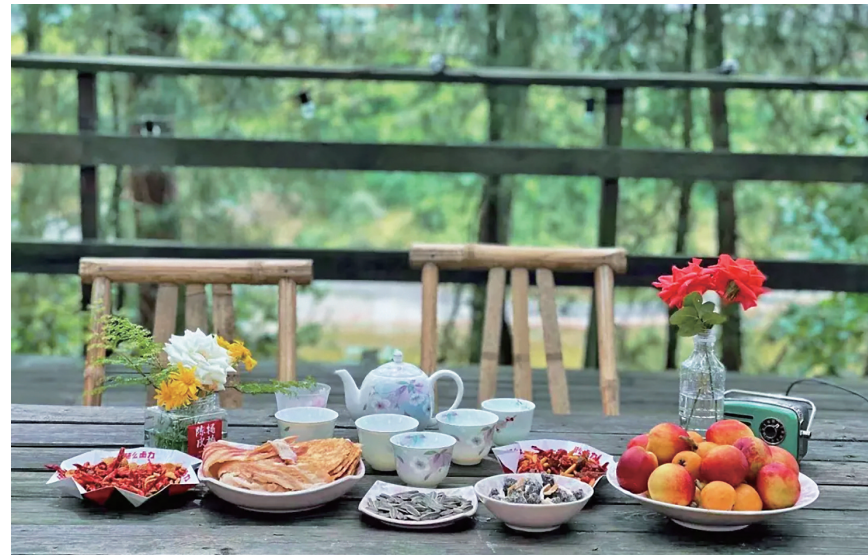
摘完蔬菜水果,再到农家小院吃瓜子花生、喝点茶,好不惬意