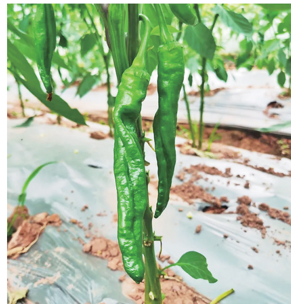
夏天的当季蔬菜种类繁多,很受市民青睐