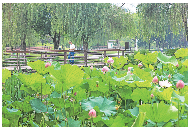
沐仙湖公园,荷花陆续开放