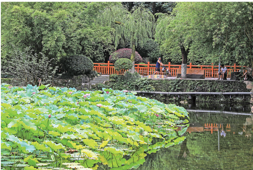
碧津公园的一池碧荷