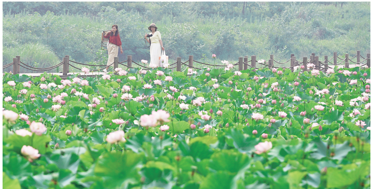
游客在木耳镇伍家坝赏花拍照