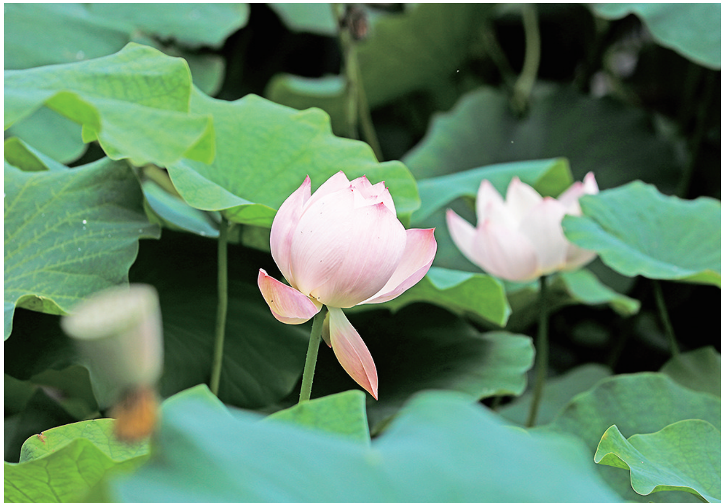
一朵朵美丽的花儿掩映在翠绿的荷叶中,宛如一幅美丽的画卷