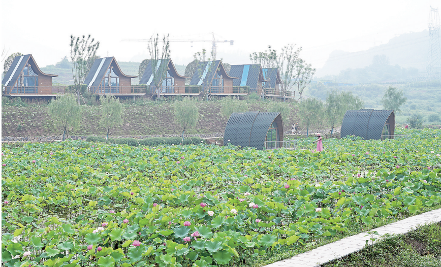
木耳镇伍家坝荷塘旁还有民宿和火锅店,游客可以一边品尝美食,一边赏荷花