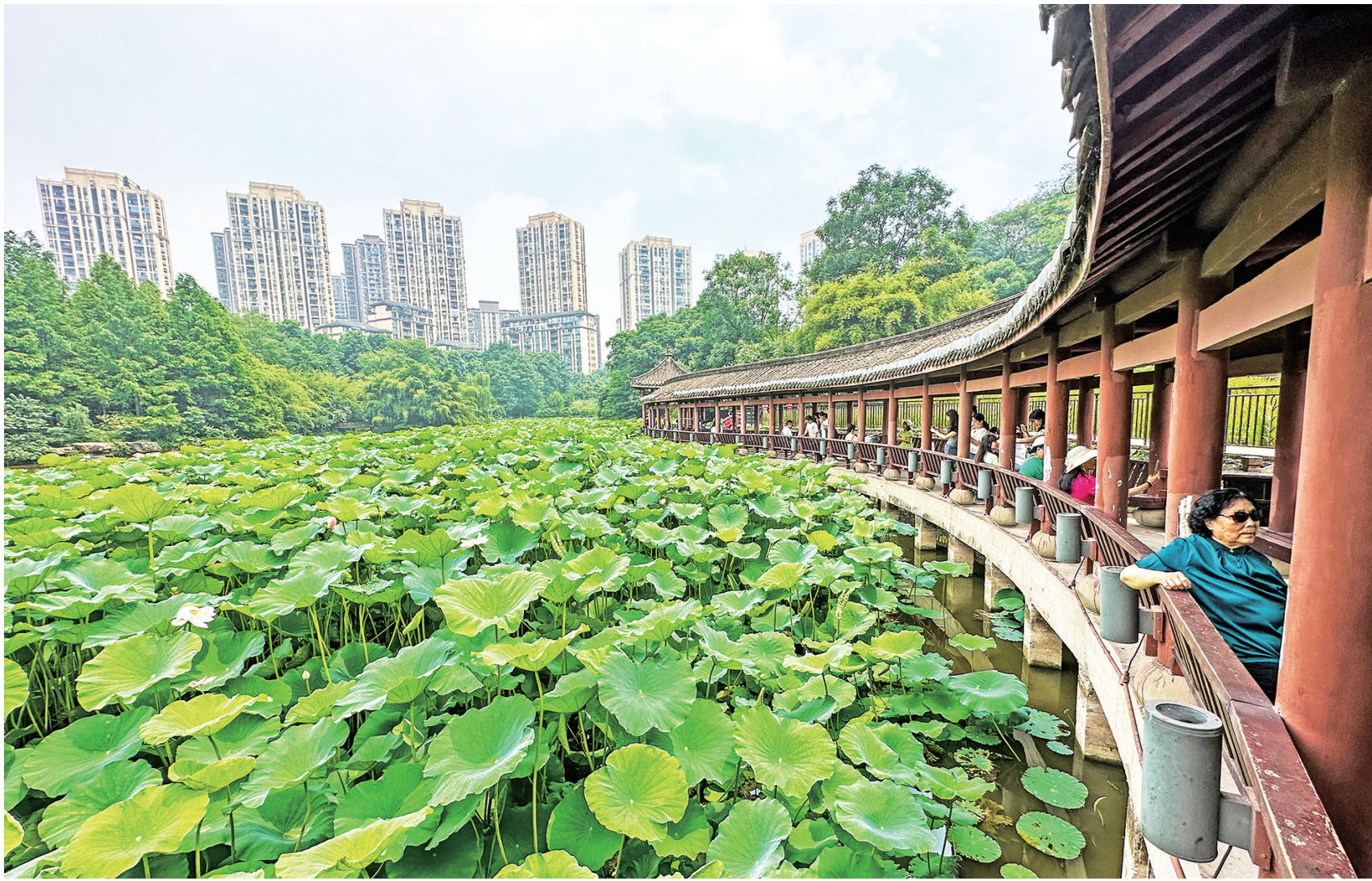
龙头寺公园的荷花颇具规模,是夏日游玩赏花的好去处