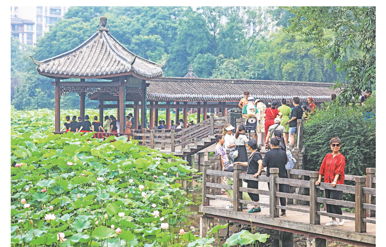
龙头寺公园,前来赏荷的市民络绎不绝