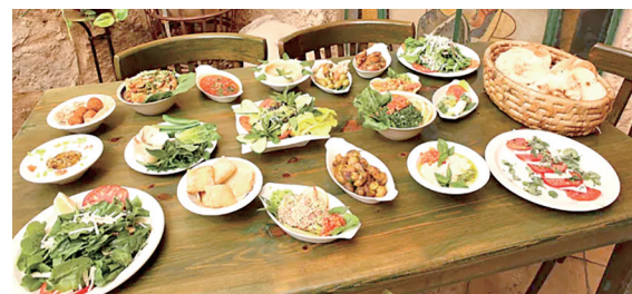
异域美食

织旅行社、投资者等实地考察重庆文化特色旅游景区、重点招商项目、精品旅游线路、文化园区、特色小镇等,进一步深化文化产业和旅游产业合作。