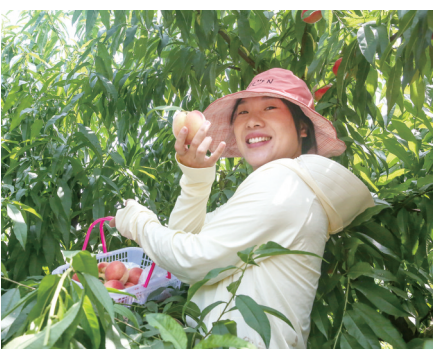
市民采摘糖桃

本报(记者 王彦雷 见习记者 黄楠)流光半夏,美好日长。今年3月,统景镇荣光村桃花岛繁花似锦,首次迎客,伴随夏至到来,灼灼的桃花蜕变成沉甸甸的果实,荣光村400余亩夏至糖桃迎来了最佳赏味季。