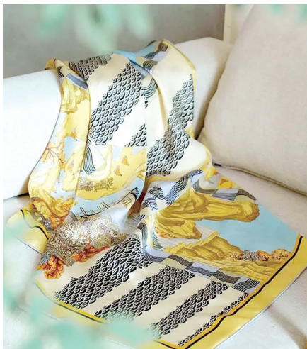
文创产品创意丝巾