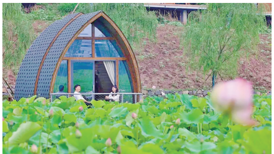
木耳镇新村花田坝子荷花盛开