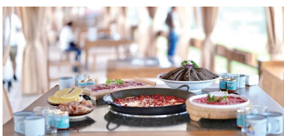
荷花池旁的火锅店开业,市民可以一边赏花,一边吃火锅