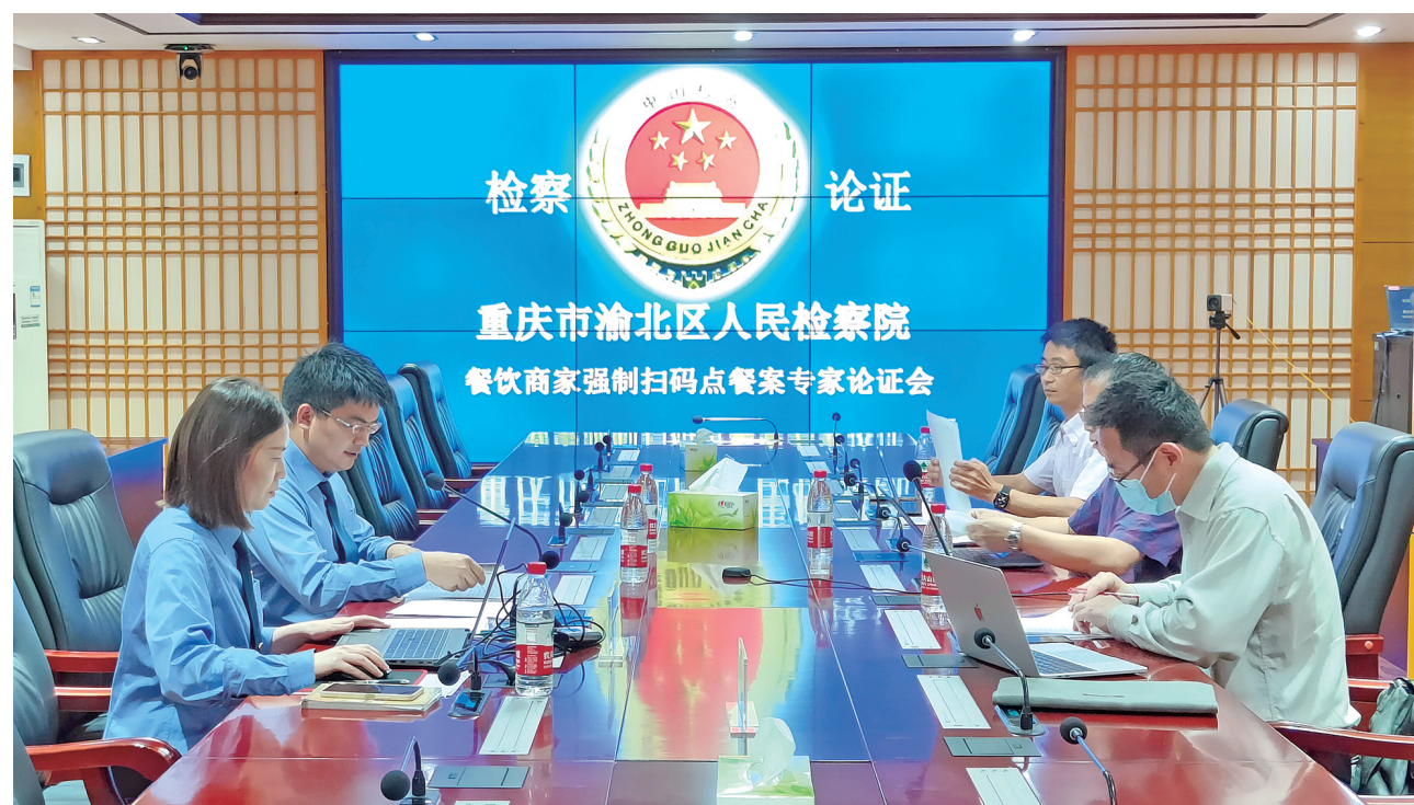
区检察院邀请相关领域专家对餐饮商家强制扫码点餐进行论证