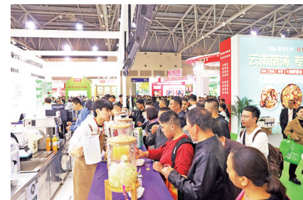
现场展示的饮品供市民品鉴