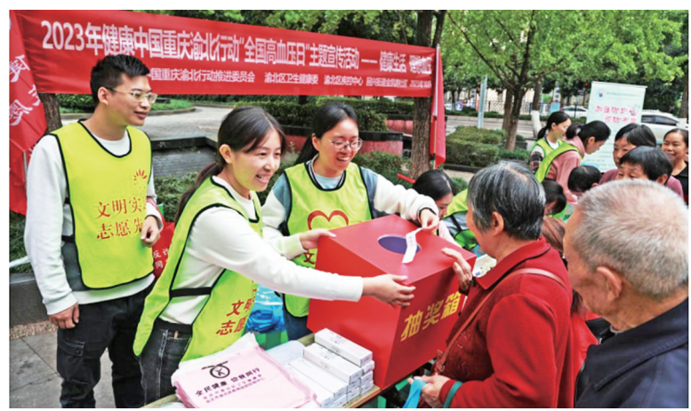
有奖答题,让市民在游戏中了解健康知识

我区开展「全国高血压日」宣传活动。本报讯(记者 杨荟琳 通讯员 杨灿桃)近日,区疾控中心联合回兴街道金凯路社区在金香林小区开展“全国高血压日”主题宣传活动,旨在进一步提高广大居民对高血压的知晓率,加强日常血压的自我管理。 活动现场,医护人员为居民免费测量血压,耐心解答高血压防治中存在的问题,提供血压控制指导,普及“三减三健”、国家基本公共卫生服务项目等健康知识。本次活动共发放宣传资料约2000份、宣传品400件,惠及400余人。 活动现场还采取“有奖竞猜”的形式,将高血压防治知识与游戏相结合,带动更多群众参与其中,在愉快游戏氛围中了解健康生活方式的有关知识。