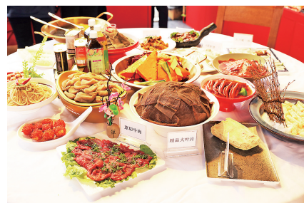
琳琅满目的火锅食材