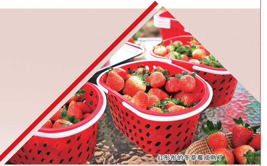
红彤彤的草莓成熟了