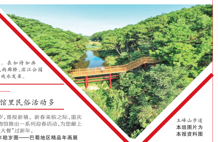
玉峰山步道