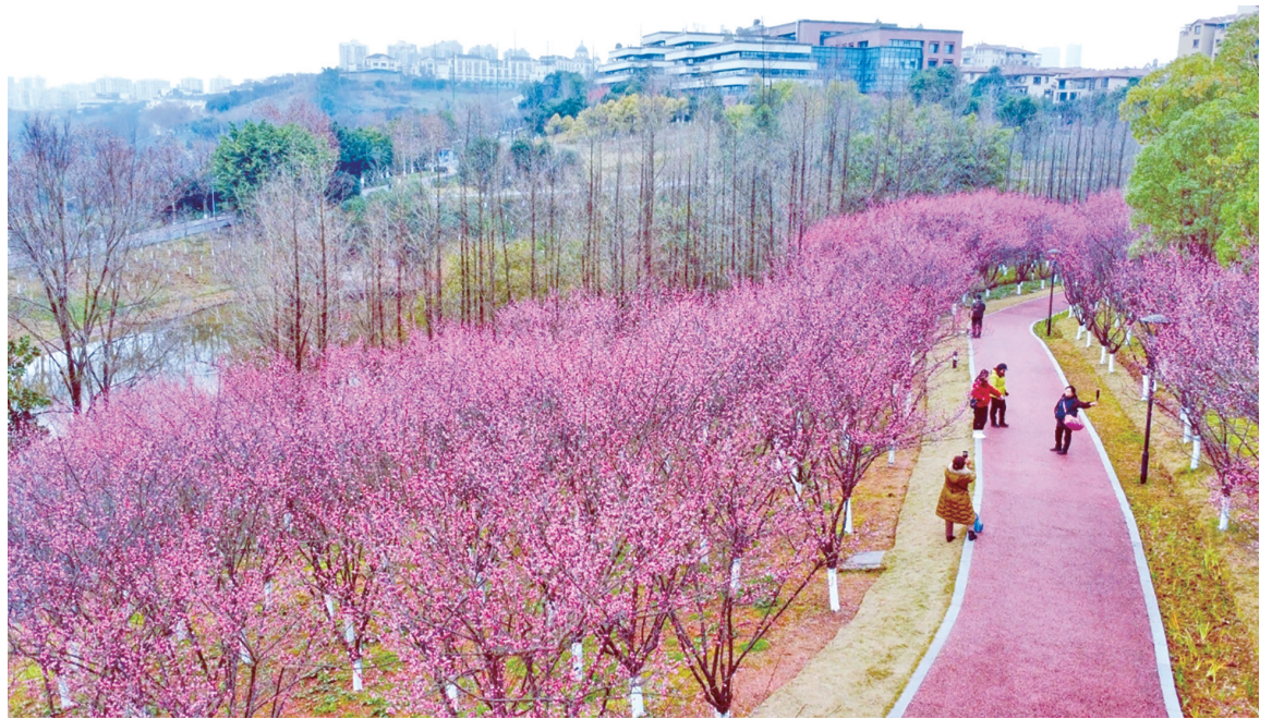
跳墩河公园,成片的美人梅盛开