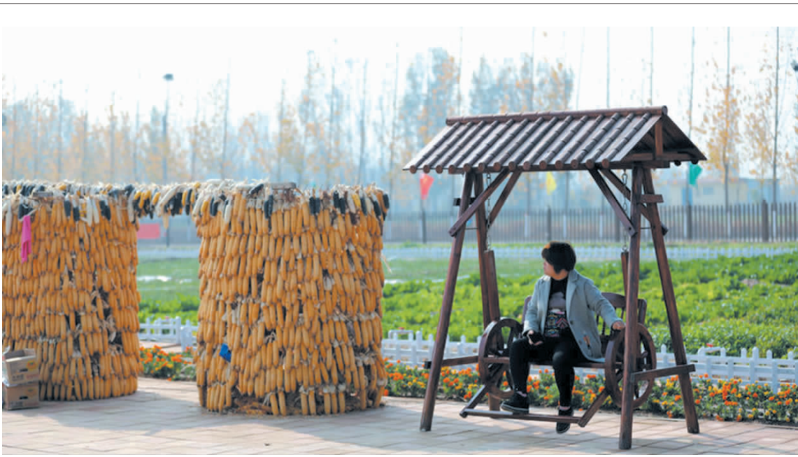
房寺镇:8000农民吃上“旅游饭”

加强值班,及时应对。严格落实24小时值班制度,随时掌握安全生产动态,一旦发生安全事故,各部门第一时间上报,及时启动应急预案,最大限度减少事故造成的损失。