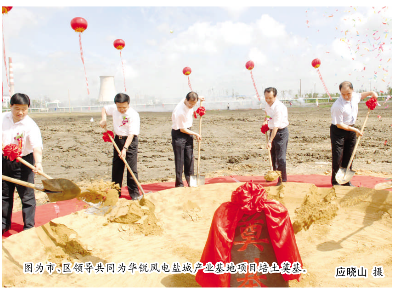
图为市、区领导共同为华锐风电盐城产业基地项目培土奠基。

赵鹏在讲话中指出,盐城风能资源丰富,在江苏风电产业发展中占有举足轻重的地位,随着沿海开发上升为国家战略、苏通大桥通车和长三角一体化进程加快,盐城的比较优势日益凸现。华锐公司选择在盐都兴建风电产业基地,充分表明了企业的战略智慧和眼光,同时也是对盐都乃至盐城投资环境的充分