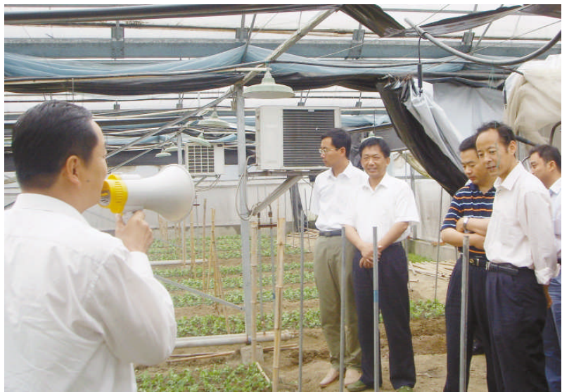
区国土局全体人员走进企业推进“三服务”工作。

土地,生命之源、民生之本、发展之基、财富之母。盐都从1988年设置土地管理部门到2004年实施省级以下垂直管理,国土资源经历了从无到有、从分散到整合、从粗放到集约、从无序到规范,实现了由单一行政计划管理到行政、法制、经济等手段相结合的管理轨道。