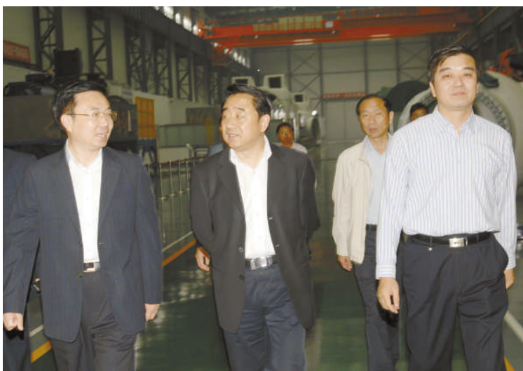
图为陈震宁（左二）在区领导的陪同下，到华锐风电产业园调研。

当得知我区正同步建设高新区电子信息产业园时，陈震宁表示赞赏，并鼓励我区在电子信息产业发展中注重发挥骨干企业和优势产品的带动作用，提高研发能力，拉长增粗产业链。（应伟）