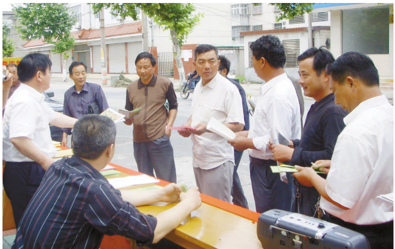
“土地日”宣传送法活动现场。