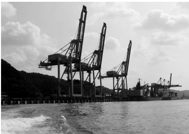
基隆港位于台湾岛北端,为台湾北部重要的天然良港,也是海运转运中心辅助港——高价值货物进出口港。以货柜为主,散货为辅,是环岛航运之主要枢纽港,结合观光,亲水性之港口。