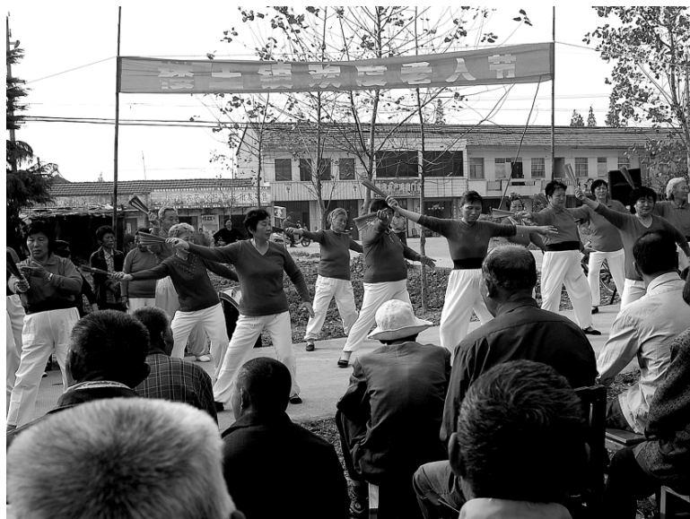
10月26日,楼王镇老龄委、妇联、团委等部门组织夕阳红健身队、小童星表演队,到镇中心敬老院开展尊老敬老系列活动。图为夕阳红健身队在为孤寡老人表演。

在本次流动人口计生检查中,新区还加大流动人口计生专项整治力度,多次向外来人员进行了相关法律、法规、权利与义务的宣传,使流动人口管理和服务工作达到正常化、规范化、法制化要求。(周华 王希德)