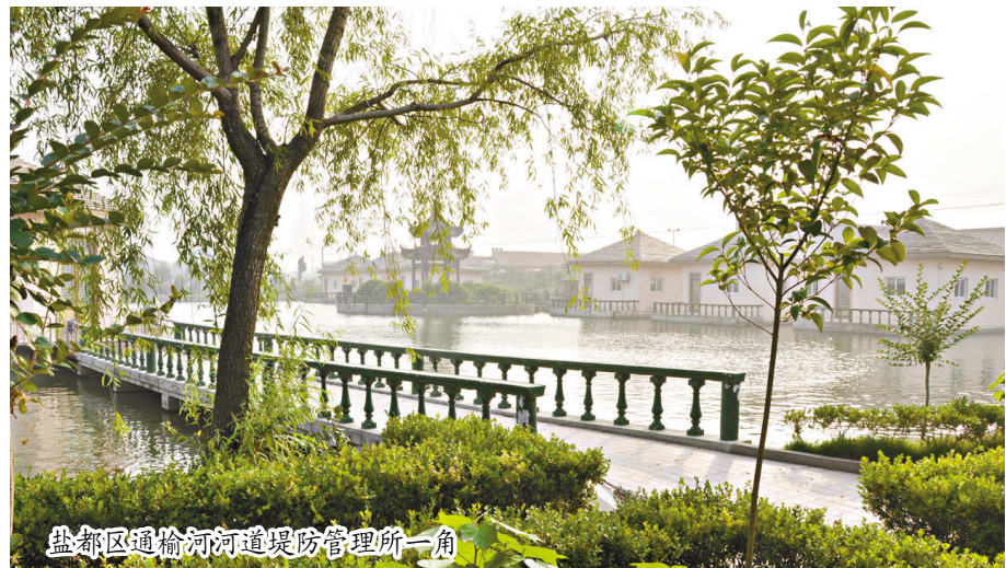
盐都区通榆河河道堤防管理所一角