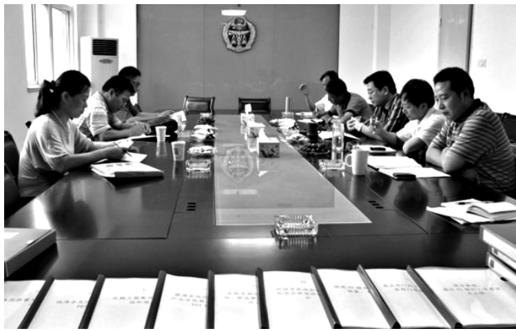
8月26日,市质监局督查验收组来到盐都质监局,对我区推进纯净水企业使用PC桶工作进行考核验收。督查验收组在听取了盐都质监局的情况汇报,查看了台账资料,并抽查了百利达、立康、紫荆花3家纯净水生产企业进行现场考察后,对我区的工作表示了肯定。图为汇报会现场。

中国盐都网 http://www.yandu.gov.cn 盐都报道电子版 http://ydbd.yandu.gov.cn 电话:88426276 邮箱:xt@yandu.gov.cn