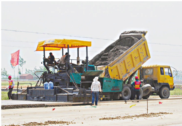
229省道盐都段改扩建工程,全长14.729千米,设计速度为每小时100千米,双向四车道,路基顶面宽26米。目前,东半幅12%灰土底基层施工基本结束,已进入水稳基层铺设施工阶段,预计在6月底东半幅实现全线通车。图为该工程盐都段进行水稳基层铺设施工现场面。

该所重抓窗口服务,着力提升服务效能,将户籍管理规定、户口登记、居民身份证的办理条件、程序、收费标准等内容公布在户政大厅,并要求全体民警和协警微笑接待群众,耐心解答群众提问,确保群众满意而归。该所在近阶段办理电动车牌照时,主动为群众着想,采取进村到户“零距离”的服务方式,到各个村为群众办理车牌,并给群众安装车牌,这一做法受到群众的一致好评。(陶海霞)