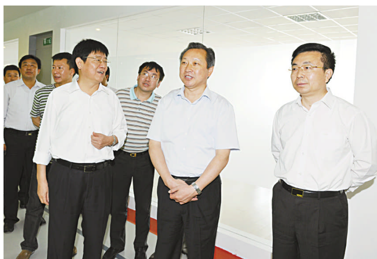
图为市委书记赵鹏（中）在区委书记李纯涛（右）等陪同下，到重啤集团盐城公司调研，了解生产情况。

随后，赵鹏等人来到新材料产业园高性能纤维项目建设现场。该项目总投资10亿元，建筑面积10万平方米，计划在3年内新上20条高性能纤维生产线。至目前，该项目一期主体厂房已经竣工，4条生产线已安装完毕，另有4条生产线正在紧张调试。赵鹏指出，新材料产业是