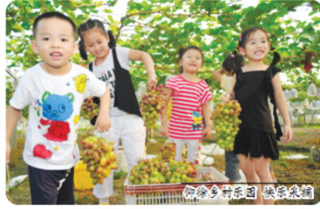
杨侍乡村乐园 快乐采摘