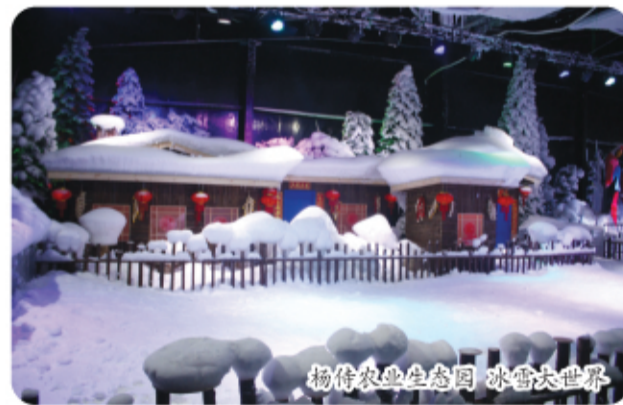
杨侍农业生态园 冰雪大世界