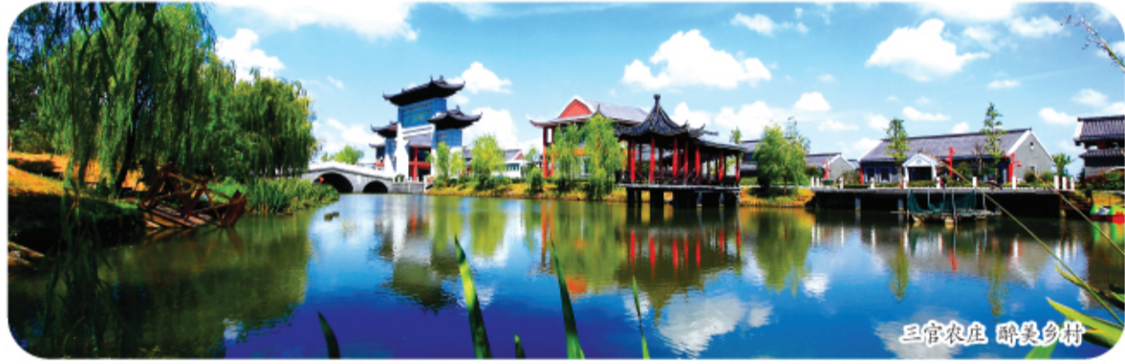
三官农庄 诗意乡村