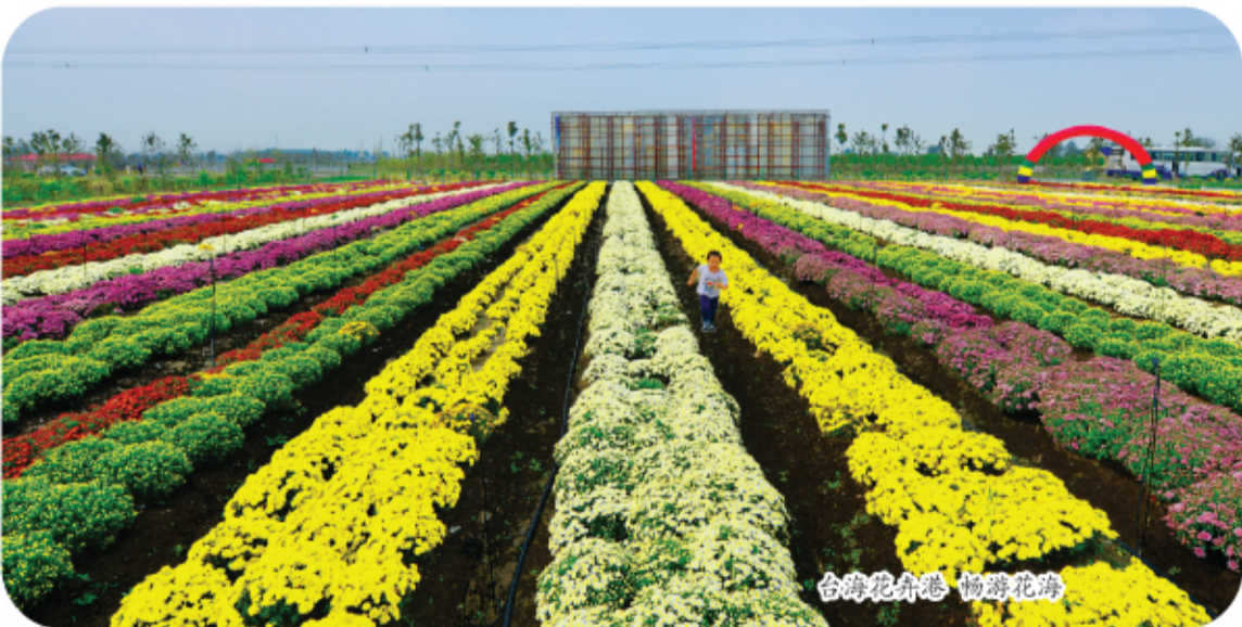
台海花卉港 畅游花海