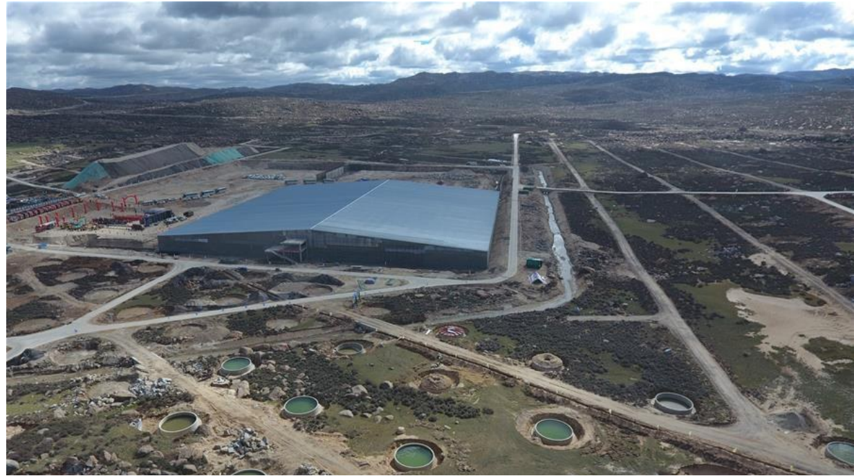
▲6月19日,经过8年筹备工作,我国高海拔宇宙线观测站(LHAASO)正式开工。高海拔宇宙线观测站是“十二五”期间启动的国家重大科技基础设施项目,以探索高能宇宙线起源并开展相关的高能辐射、天体演化以及暗物质分布等基础科学研究为核心目标。该项目建设在平均海拔4410米的四川省稻城县海子山,建设周期为5年。图为航拍观测站内的缪子探测器(6月19日摄)。