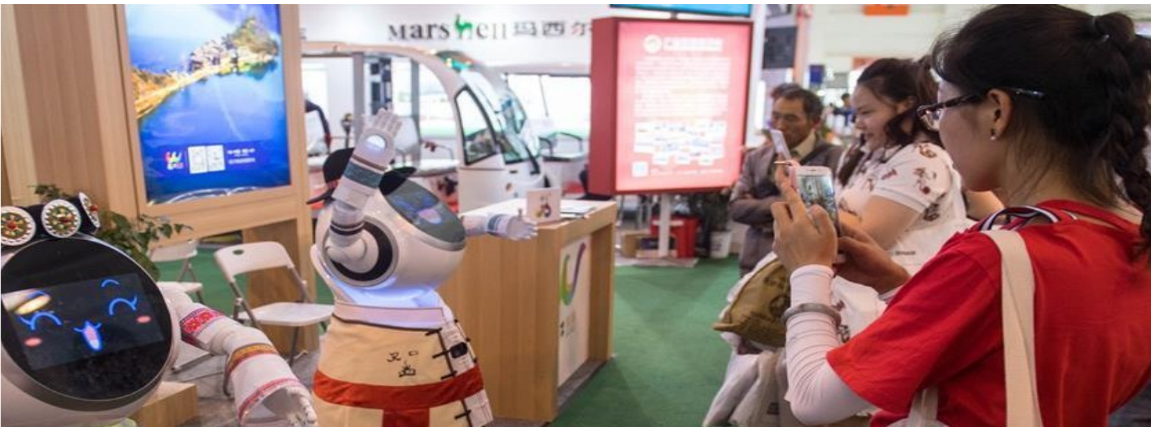
▲6月14日至20日,第5届中国-南亚博览会暨第25届中国昆明进出口商品交易会在云南昆明举行。本届展会前4天吸引45万人次前来观展。图为参观者在第5届中国-南亚博览会上拍摄会跳民族舞蹈的机器人(6月18日摄)。