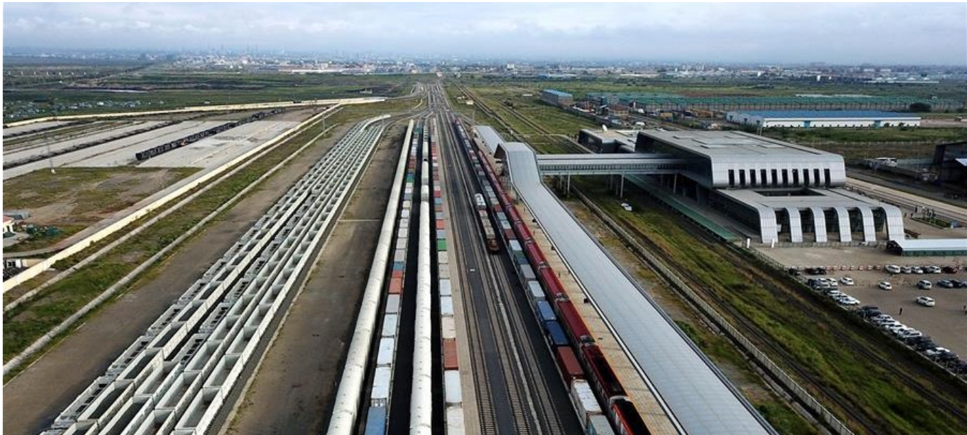
▲连接肯尼亚东部港口城市蒙巴萨与首都内罗毕的蒙内铁路2017年5月31日正式开通,是肯尼亚独立以来的首条新铁路,由中国路桥工程有限责任公司承建,全线采用中国标准、中国技术、中国装备,并签订了为期10年的运营维护合同,是一条采用“中国标准”全方位运营维护的国际干线铁路。要在海外运营一条铁路,本地化人才必不可少。数据显示,目前在蒙内铁路从事运营工作的当地员工达1570人,占比70%,其中不乏未来有望成为骨干的肯尼亚青年。图为6月3日,列车停靠在肯尼亚蒙内铁路内罗毕站(航拍照片)。