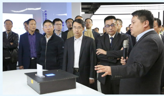
与会领导和嘉宾在东山精密产业园听取产品介绍