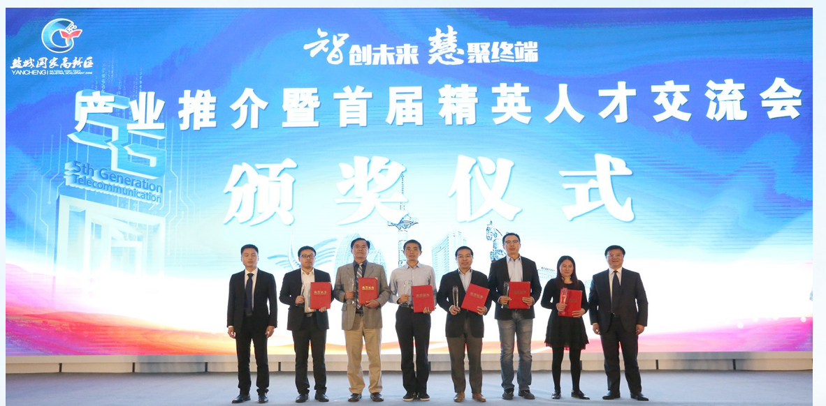
“才聚高新·智赢未来”高层次人才创业大赛颁奖仪式