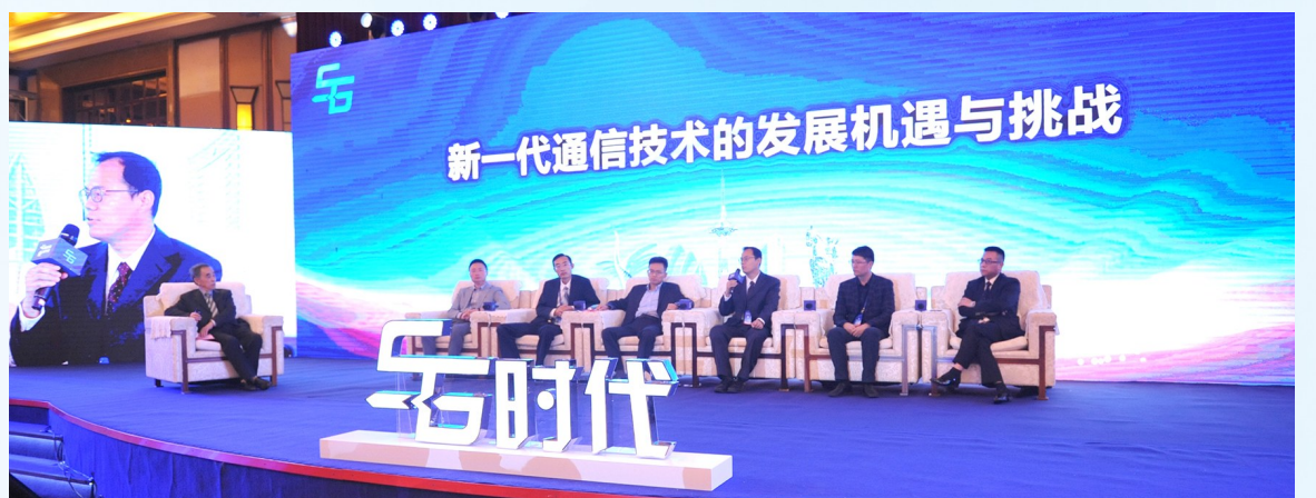
5G商用智能终端会议就新一代通信技术的发展与挑战进行“圆桌对话”