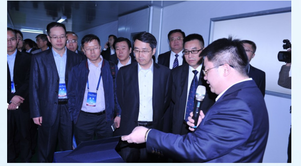
与会领导和嘉宾共同参观华旭光电生产车间