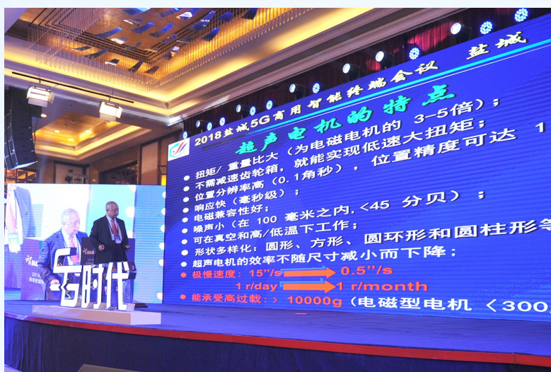
赵淳生院士在5G商用智能终端会议上作主旨演讲