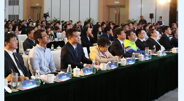
“智创未来·慧聚终端”产业推介暨首届精英人才交流会会场

5G什么时候来?会改变什么?有什么机遇和挑战?这些疑问在10月18日召开的“2018盐城5G商用智能终端会议”和“智创未来·慧聚终端”产业推介暨首届精英人才交流会上找到了答案。