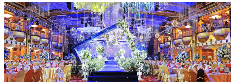
中洋金砖特大宴会厅

中洋房地产为国家一级房地产开发企业资质,是中国房地产业协会常务理事单位、副会长单位,具有20多年房地产开发经验,不以规模见长,而以品质取胜,一直用前瞻性和耐久性的战略发展眼光,坚持走高品质楼盘路线,以业主居住的幸福指数衡量住宅的最高标准为追求,充分利用国内外先进的、成熟的绿色环保技术和材料,高度生态化、智能化,最大限度地提升居住的舒适度,建成国家标准的绿色节能、低碳生活示范住