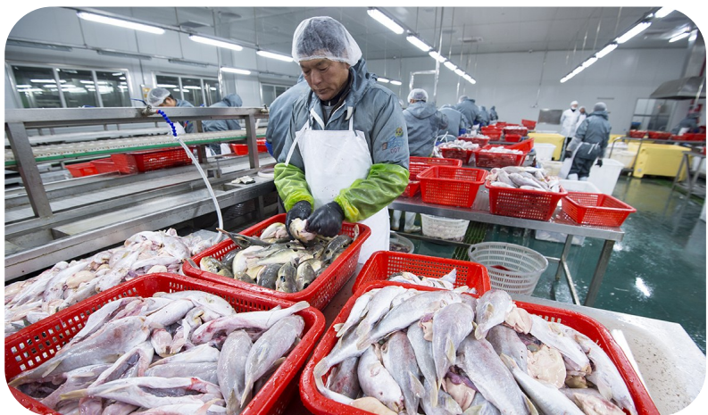
现代化河豚鱼加工生产线