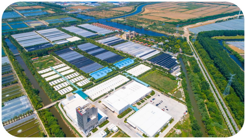
中洋现代渔业科技产业园航拍