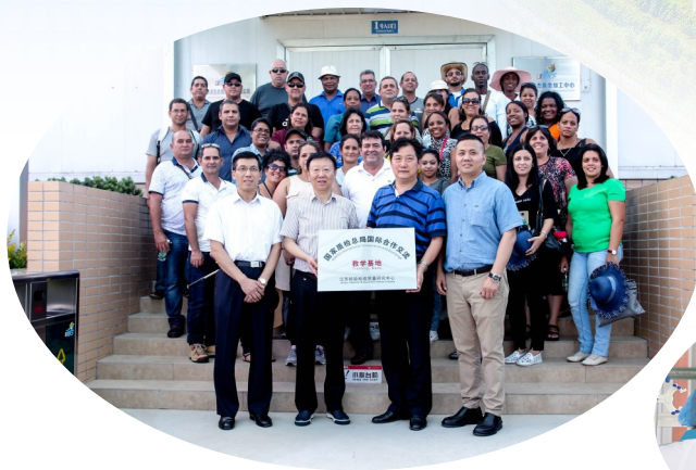
中洋现代渔业开展国际合作