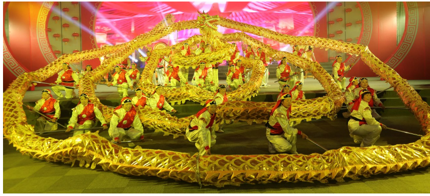
龙舞、狮舞、鼓舞《龙腾狮跃幸福年》