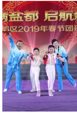
数来宝《爱我你就抱抱我》