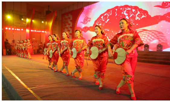
广场舞联盟《乐动万家，健身盐都》