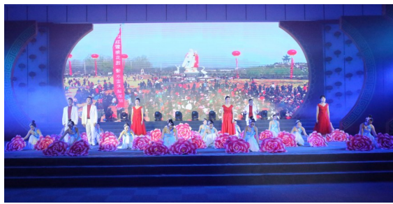
音诗舞组合《迈进新时代》