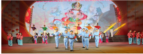
戏曲联唱《传承经典唱大戏》