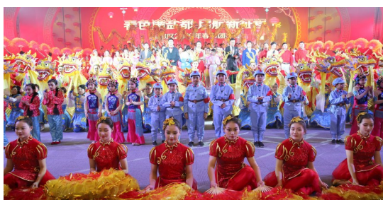
全体演职人员谢幕