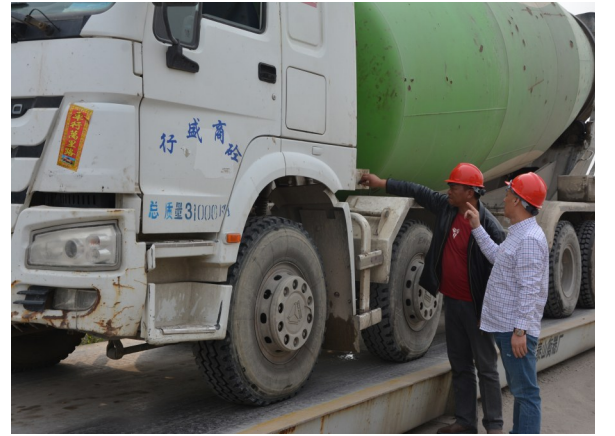
罐装车出厂前检查