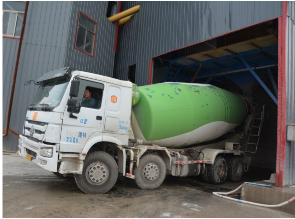
水泥罐装车进行装料