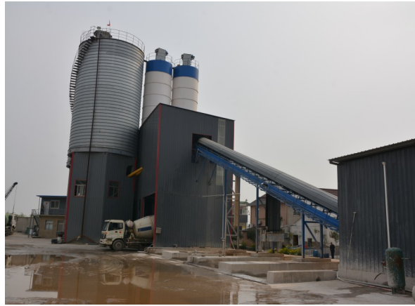
军营行盛建材有限公司厂房