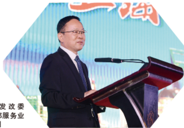
区发改委 推介盐都服务业 招商项目