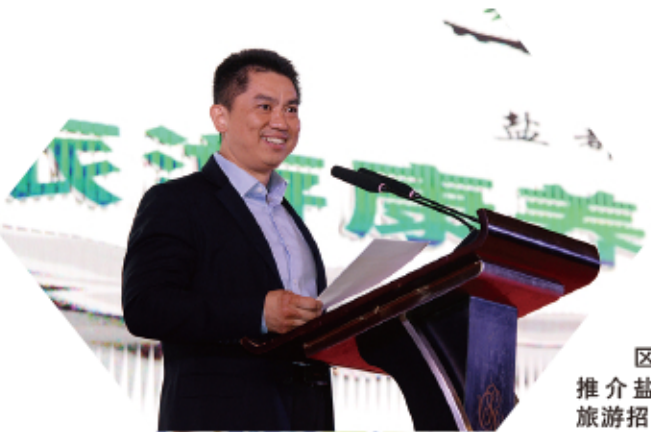
区文旅局 推介盐都文化 旅游招商项目