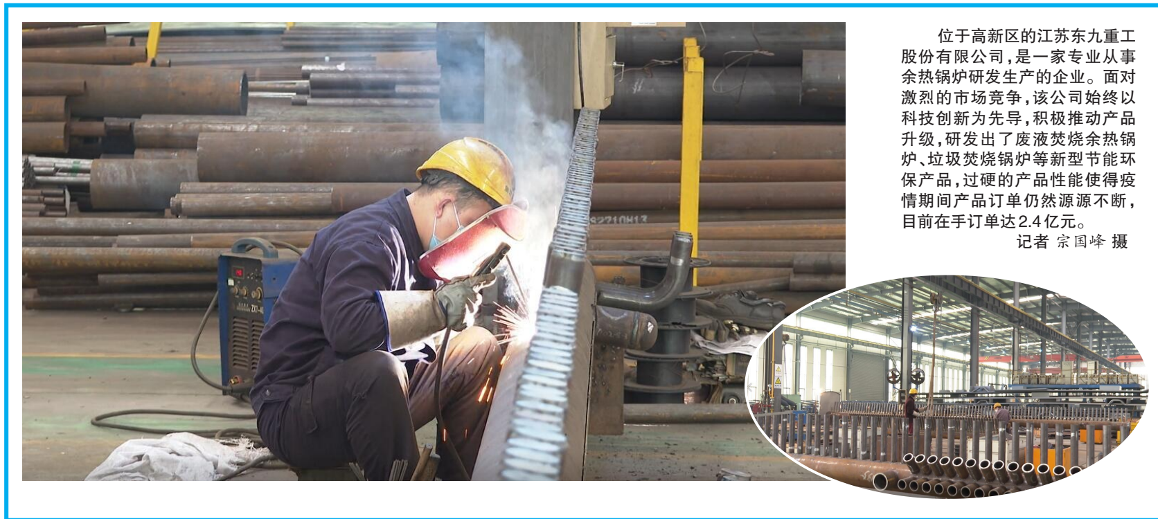
位于高新区的江苏东九重股份有限公司,是一家专业从事余热锅炉研发生产的企业。面对激烈的市场竞争,该公司始终以科技创新为先导,积极推动产品升级,研发出了废液焚烧余热锅炉、垃圾焚烧锅炉等新型节能环保产品,过硬的产品性能使得疫情期间产品订单仍然源源不断,目前在手订单达2.4亿元。