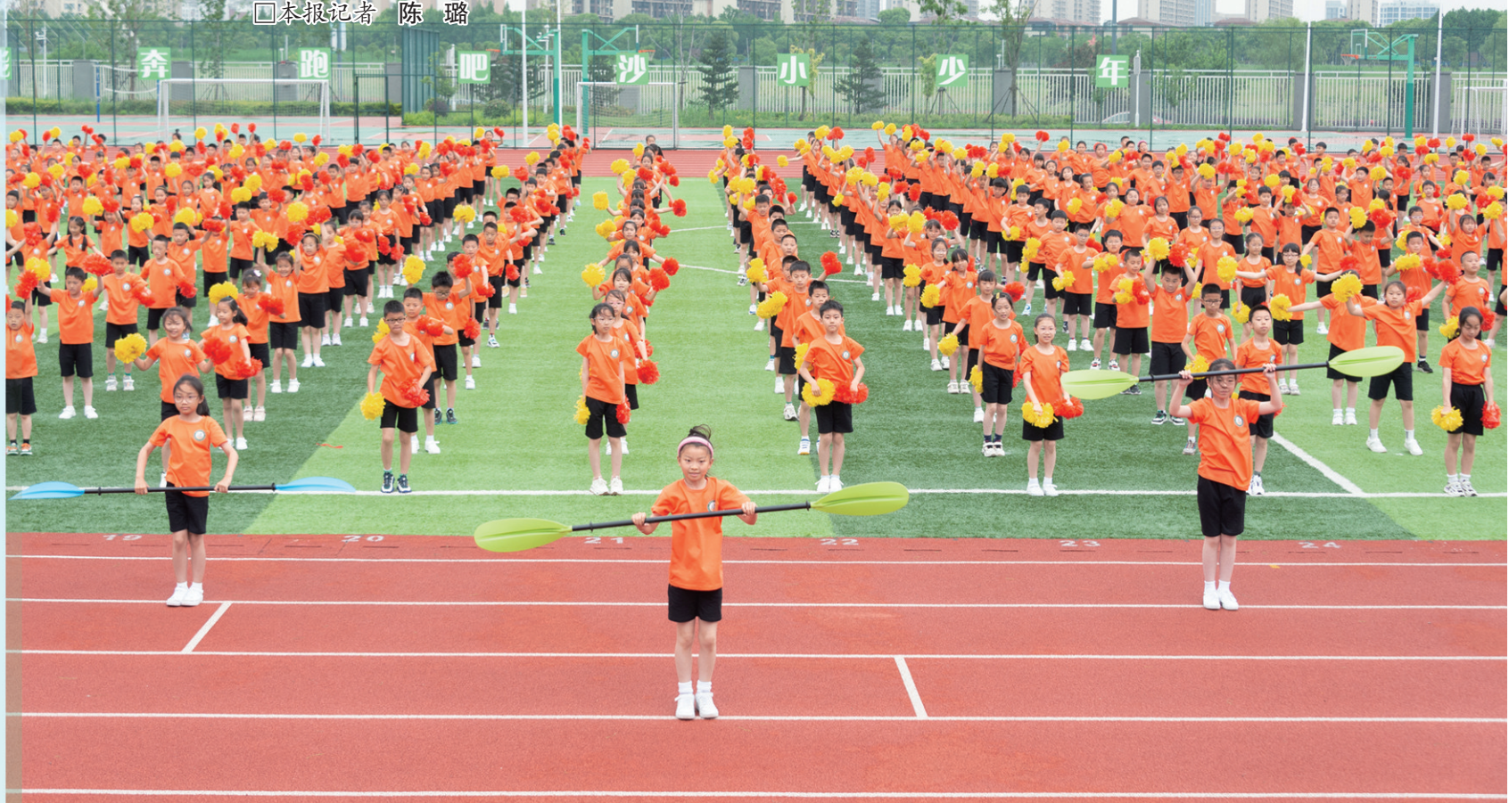
沙洲小学团体操《一起向未来》

5月31日,“沙洲教育”20年巡礼暨“劲沙洲”体育发展联盟首届田径运动会开幕式在沙洲小学举行。活动回顾了冶金工业园(锦丰镇)成立二十周年以来,园镇教育的蝶变过程。据悉,目前园镇共有14所中小学幼儿园、近2万名在校学生、1500余名教职工,教育布局合理,教师结构优化,形成了学段完整、体制多样、机制灵活、特色鲜明、成效显著的教育生态系统,并呈现出协同发展、集群发展、品牌发展的“三大发展”新样态。