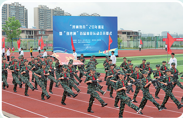
合兴小学少年军校方阵