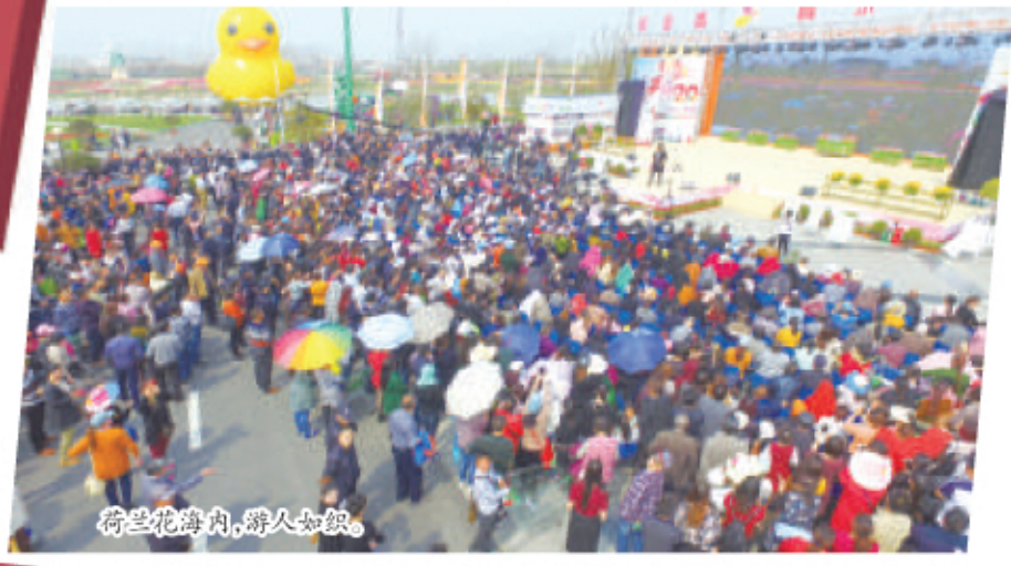
荷兰花海内,游人如织。

大丰旅游近两年呈现出厚积薄发之势。看看去年大丰旅游大数据:2015年,我区接待国内外游客1000万人次,同比增长69.5%;实现旅游综合收入65亿元,同比增长18.2%。再看今年“五一”小长假期间的旅游数据:“五一”期间,我区接待游客64.8万人次,实现门票收入912.3万元,实现旅游总收入2.83亿元,分别同比增长15.9%、28.5%、31%。 旅游类消费中,门票收入是一个重要指标。但在大丰,旅游产业已经从门票经济转向全域旅游发展新格局。从“五一”旅游数据中可以看出,我区旅游总收入的增幅已经超过门票收入的增幅。最为典型的例子当然在荷兰花海。除了门票、餐饮、住宿、购物、活动……每一项都能“生钱”。旅游不仅是“看看看”,更可以“买买买”,荷兰花海不仅让游客纷至沓来,更带动“赏花消费”一路升温。放眼大丰,全域旅游的理念不仅体现在地理方位上,更被延伸到全产业链条上。旅游产业不仅成为推动大丰经济社会综合发展的重要动力源,还在提升城市文化品牌、改善生态环境、提升幸福指数、增加就业人口、保护与传承历史文化、促进城乡统筹等方面发挥巨大价值,成为大丰产业发展中当之无愧的明星。尤为值得关注的是,我区以旅游产业为枢纽,串联起其他一系列产业。比如旅游地产异军突起,比如旅游酒店兴旺发达……通过对旅游资源的叠加,升级旅游产业,大丰正打造一站式旅游度假地。 国家战略的导向性在不断提升旅游的重要性,市场的敏感性在不断孕育新趋势。大丰旅游业正抓住供给侧改革机遇,在不断优化旅游产品、完善旅游服务、扩大旅游消费市场方面取得新进展。近日,由长三角自驾游专家委员会、新华一长三角自驾游指数工作委员会和树岛共创共有共享工作委员会联合主办的“2016长三角自驾游十强城市”发布会,在浙江横店影视城举行,我区荣膺首批长三角自驾游发展十强城市和热门十强城市。国家大数据中,异地加油占比的提升显示出节假日期间自驾游游客的逐步增多。数据能显示出旅游消费市场的趋势和走向,而大丰跻身长三角自驾游“双十强”,可谓应时尽量,正合需求端的“胃口”。(苏南)