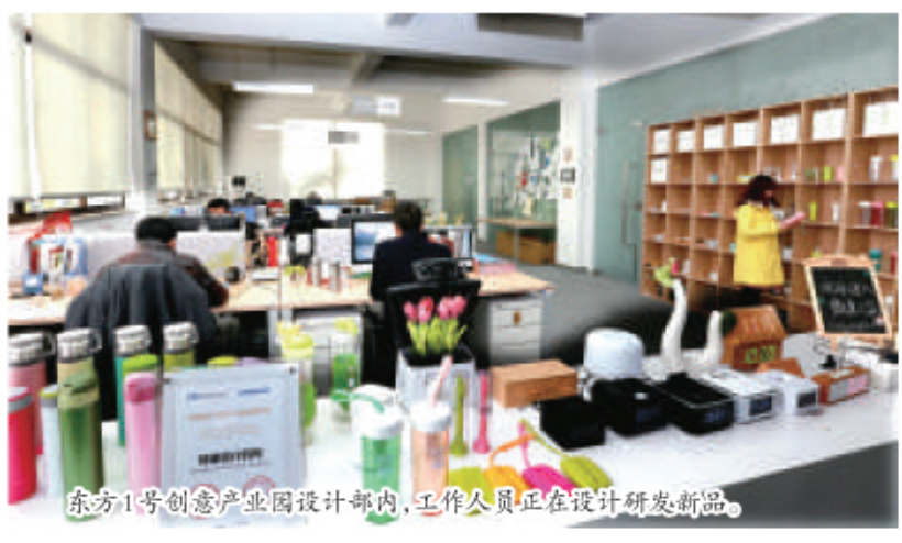
东方1号创意产业园设计部内,工作人员正在设计研发新品。

国家大数据: 超过50亿张银联卡的消费数据显示,2015年消费增速最快的行业几乎都来自服务业。物流运输行业银联网络消费金额由2014年的100.4亿元增长至351.5亿元,同比上涨250.1%,增速较上年同期提高218.5个百分点。