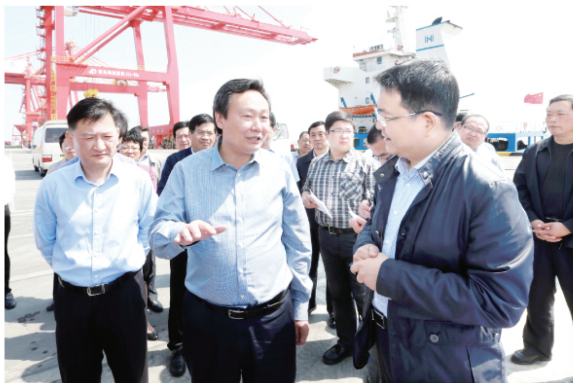
六月六日,盐城市委常委、大丰区委书记王荣(中)在集装箱码头了解码头运营情况。