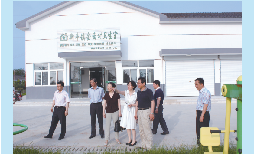
第一批兴建的卫生室,面积达200平方米左右。图为新丰镇金西村卫生室外景。