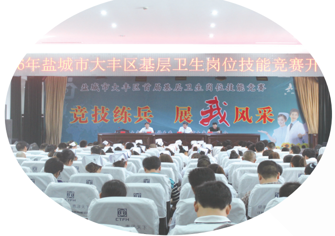
2016年9月,区总工会、区卫生计生委联合举办基层卫生岗位练兵技能竞赛。

以家庭医生(乡村医生)签约服务推动基层首诊。实现签约服务基层机构全覆盖、重点人群全覆盖、重点慢性病种全覆盖。围绕群众健康管理需求,做到基本服务与个性服务、家庭签约与个性签约、医疗保健与居家养老、一般人群与计生特困家庭相结合,在签约服务质量、水平和内涵上提优增效。区财政、人社、民政等部门,积极引导年满60周岁的医保对象和领取政府补助的居家养老对象参加签约。建立健全医保(新农合)补偿、基本公共卫生服务补助、个人自付相结合的三方签约服务补偿机制,合理分摊签约费用。 以医联体建设推进分级诊疗。分别组建了以人民医院、中医院为主导“丰医集团”和“杏林集团”2个医疗联合体。人民医院选派12名具有副高级职称的专家常年到基层门诊带教,同时,组成医疗技术小组,到基层进行业务指导和巡回诊疗;中医院选派一批名中医到基层开设中医传承工作室。畅通上下转诊通道。医联体内部开放双向转诊窗口,今年基层上转病人115例,区级医院下转到基层的康复病人218例,分级诊疗格局已经形成。 以信息化促进优质资源下沉。2014年7月,率先开通心血管、内分泌科远程视频会诊室,每周二、四对镇、村进行会诊,累计会诊568例;今年建成区域影像、心电图会诊中心,运行8个月,会诊164例;同时,借助移动互联网系统,对基层机构住院病人实现远程查房,实时指导。