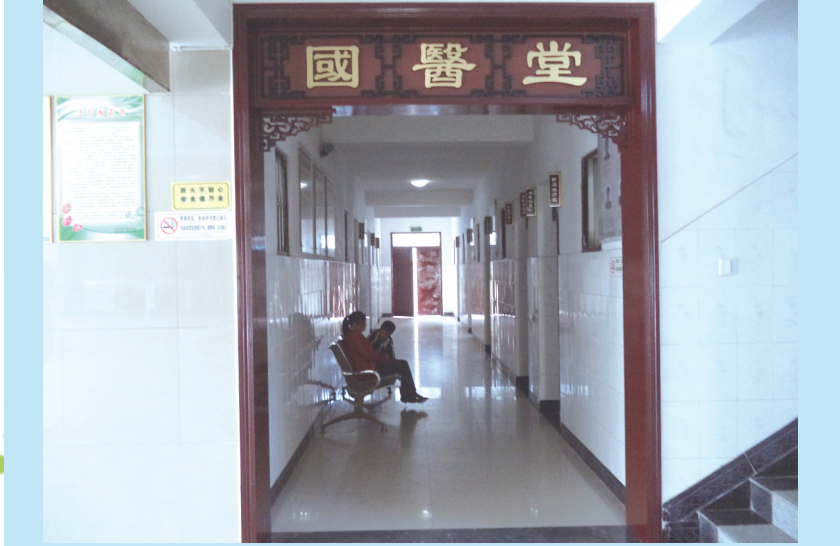
刘庄镇卫生院国医堂。