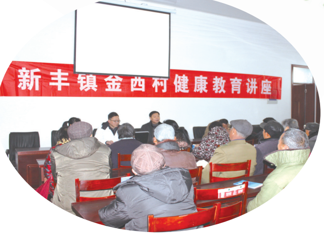
镇卫生院组建健康管理团队参与村民健康管理。图为新丰镇卫生院医生在金西村开展健康讲座。